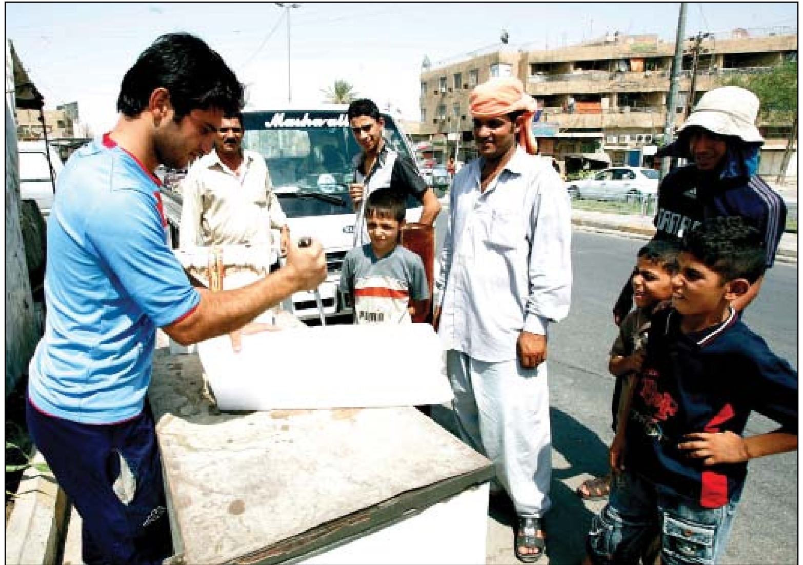
انتعاش بيع التلج في بغداد والمحافظات..

ترجمة / حامد أحمد الموصل، التي تمر اليوم الذكرى السنوية الرابعة لتحريرها من سيطرة تنظيم داعش عليها في 10 تموز 2017، تشهد الآن جهوداً متواصلة حثيثة تجاه إعادة إعمارها وعودتها لحياتها الطبيعية، رغم ان الجانب الأيمن منها المنتم للوصل القديمة ما يزال يعاني بطءاً في حركة إعادة الاعمار بسبب حجم الدمار والخراب الذي لحق بها. وكانت مدينة الموصل، ثاني أكبر مدن العراق، استمرت تحت سيطرة تنظيم داعش الإرهابي على مدى ثلاث سنوات للفترة من 2014 الى تموز 2017، وخلفت حملة التحرير التي استمرت تسعة أشهر تقريبا ما بين تشرين الاول 2016 الى تموز 2017 ما يقارب من 8 ملايين طن من أنقاض وبقايا مخلفات حربية من عبوات ناسفة وألغام زرعا التنظيم الإرهابي في مباني ومنشآت عديدة ما تزال