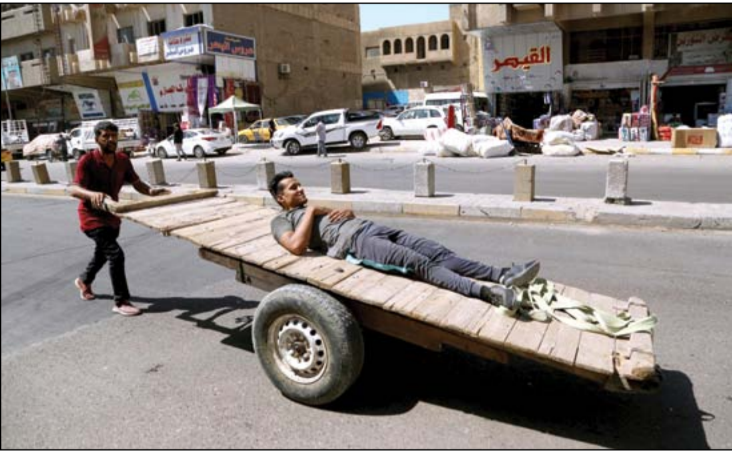
تحت أشعة الشمس الحارقة.. الشغيلة يكسحون من أجل لقمة العيش الصعبة..

وافتتاح وفرد. بالمقابل يزيد عدد المرشحين عن الـ400 مرشح، يتنافسون في 8 دوائر، لشغل 34 مقعداً مخصصاً لنينوى. وبحسب اسماء المرشحين فان نينوى ستستبدل نحو ثلث البرلمانيين الممثلين للمحافظة، حيث قرر 12 نائباً فقط عدم الترشح من جديد. ويظهر من القوائم تنافس اكثر من 10 نواب سابقين عن نينوى، و7 مسؤولين سابقين، بينهم محافظين سابقين، أحدهما ادار حكومة طوارئ في المحافظة. ولم تخل اسماء المرشحين من ابناء التشريعية في تشرين الاول المقبل. ويبلغ عدد الذين يحق لهم المشاركة الترشيدات الفردية على حصة الاسد في المحافظة. ■ التفاصيل ص3