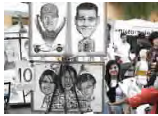
سياح ينخلون الحا رسوم كاريكاتيرية في ساحة نافونا في روما والتي تعد (مونمارتر) روما، وملاذاً لرساميا الشوارع.

ملكة جمال السابقة والممثلة الهندية بريانكا جويرا تشارك في حملة التثقيف على جذب أناس من مختلف الاقتصادات من أجل صناعة السينما في مومباي.