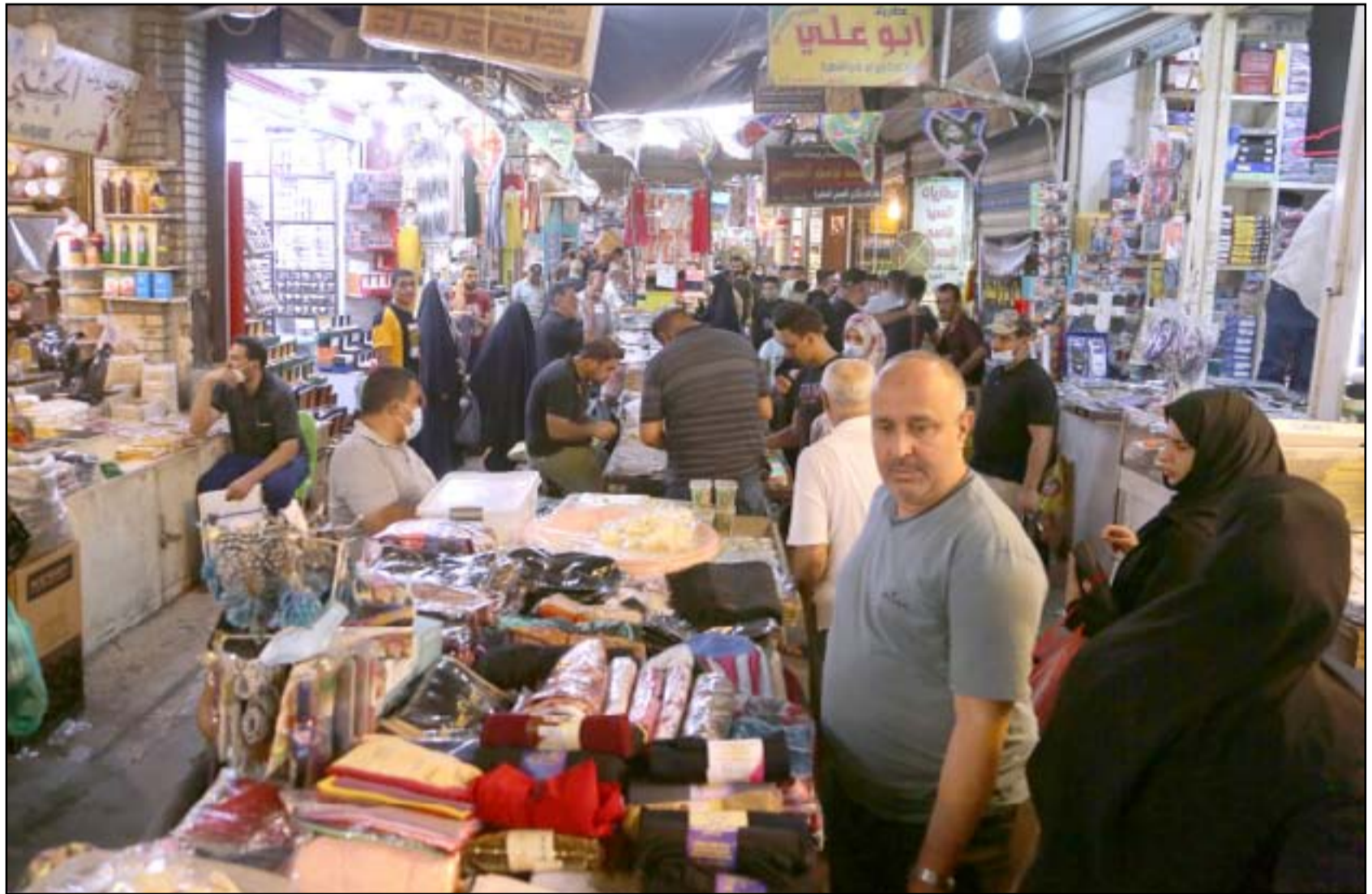
الصحّة تشكو من عدم التزام المواطنين بالإجراءات الوقائية.. ومعدل الاصابات يرتفع الى 12 الف اصابة

■ خاص / المدى أكدت المفوضية العليا للانتخابات، أمس الإثنين، انتهاء اغلب الاستعدادات الخاصة بإجراء الانتخابات النيابية في موعدها المحدد. وقالت المتحدث باسم المفوضية جمانة غلاي، في حديث لـ (المدى)، إن «المفوضية أنهت اغلب استعداداتها لإجراء الانتخابات النيابية في موعدها المحدد في تشرين الأول/أكتوبر المقبل». وأضافت غلاي، أن «المفوضية هي الآن بصدد طباعة أوراق المرشحين الخاصة