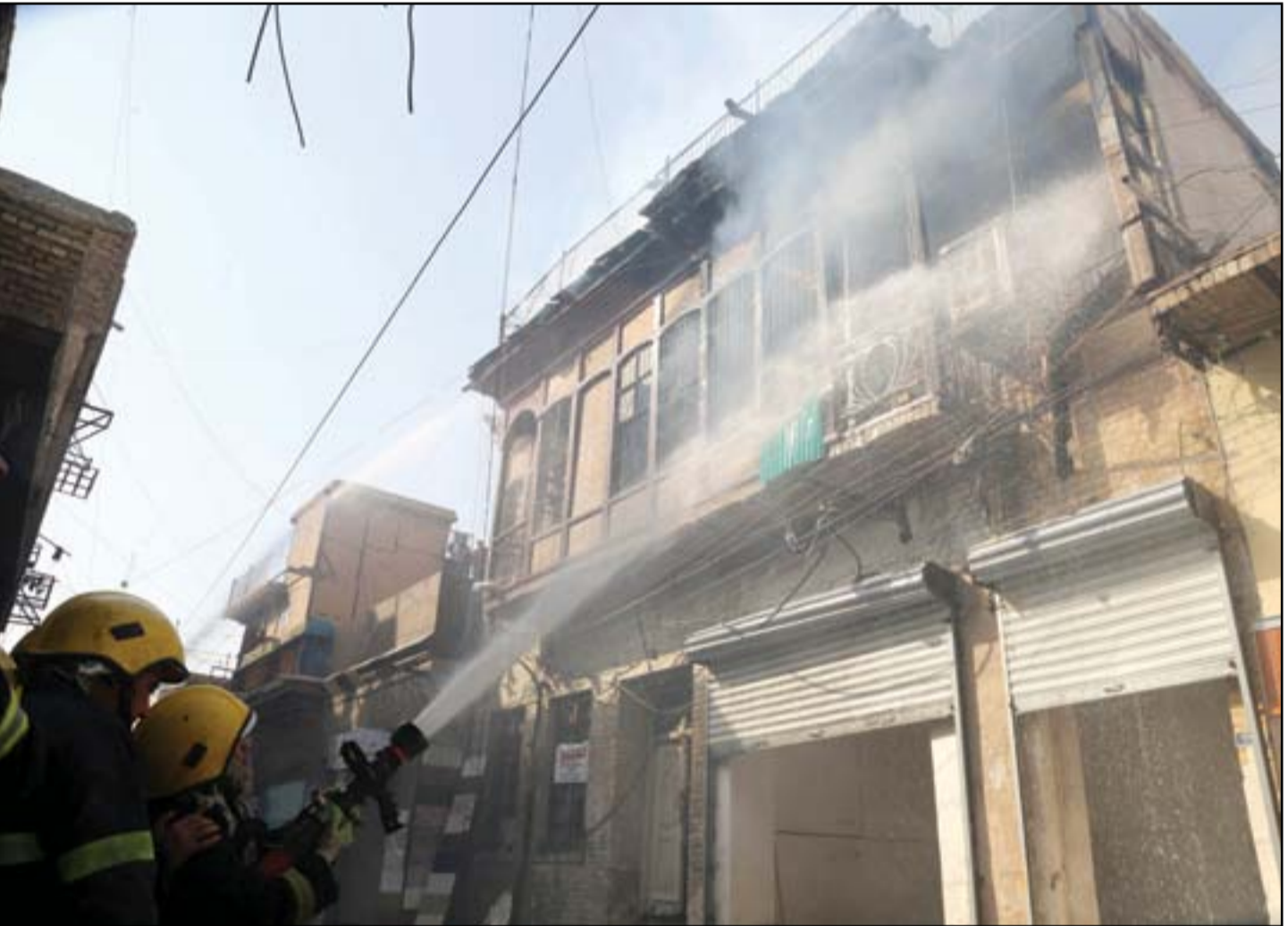
حريق يلتهم منزلاً أثرياً في منطقة السعدون وسط بغداد

■ بغداد/ تميم الحسن في أكبر مركزين دينيين في البلاد حيث العتبات الشيعية في النجف وكربلاء يتنافس أكثر من 600 مرشح لشغل 23 مقعداً، 6 منها مخصصة للنساء. وقرر 10 نواب فقط من المحافظتين إعادة ترشحهم بالانتخابات التشريعية المقبلة، في أقل عدد للنواب الحاليين الذين سيخولون المنافسة بين المحافظتين. ويغيب بالمقابل المحافظون الحاليون عن السباق في النجف وكربلاء، بينما يعود المحافظون السابقون إلى الترشح. وتظهر في قوائم المرشحين أسماء اثارث الرأي العام بسبب قضية "رواتب رفحاء"، حيث يترشح أحد تلك الاسماء مع ابنته في قائمة واحدة. الذين سيخولون المنافسة بين المحافظتين. ويغيب بالمقابل المحافظون الحاليون عن السباق في النجف وكربلاء، بينما يعود المحافظون السابقون إلى الترشح. وتظهر في قوائم المرشحين أسماء اثارث الرأي العام بسبب قضية "رواتب رفحاء"، حيث يترشح أحد تلك الاسماء مع ابنته في قائمة واحدة.