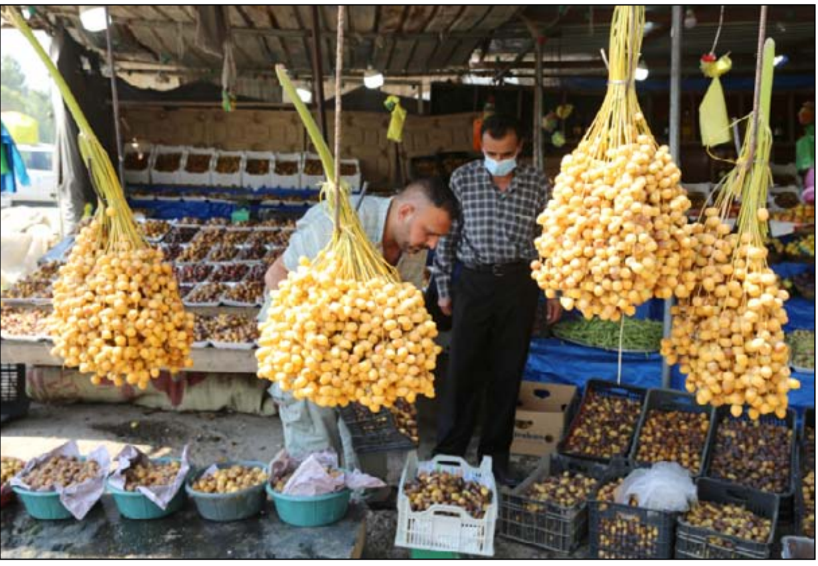
تدور عراقية في الاسواق...

مفاجآت في كركوك مع بداية التحضيرات للانتخابات التشريعية المبكرة المفترض إجراؤها في تشرين الأول المقبل. أبرز المفاجآت عودة الحزب الديمقراطي الكردستاني بزعامة مسعود بارزاني الى المنافسة في كركوك بعد مقاطعة الانتخابات الماضية. وحديث الحزب عن "متغيرات" ستجري في الفترة القادمة، لصالح "تطبيع" الأوضاع في المحافظة وتقاسم السلطة. كذلك استبدل حزب الاتحاد الوطني الكردستاني - الذي انقرد