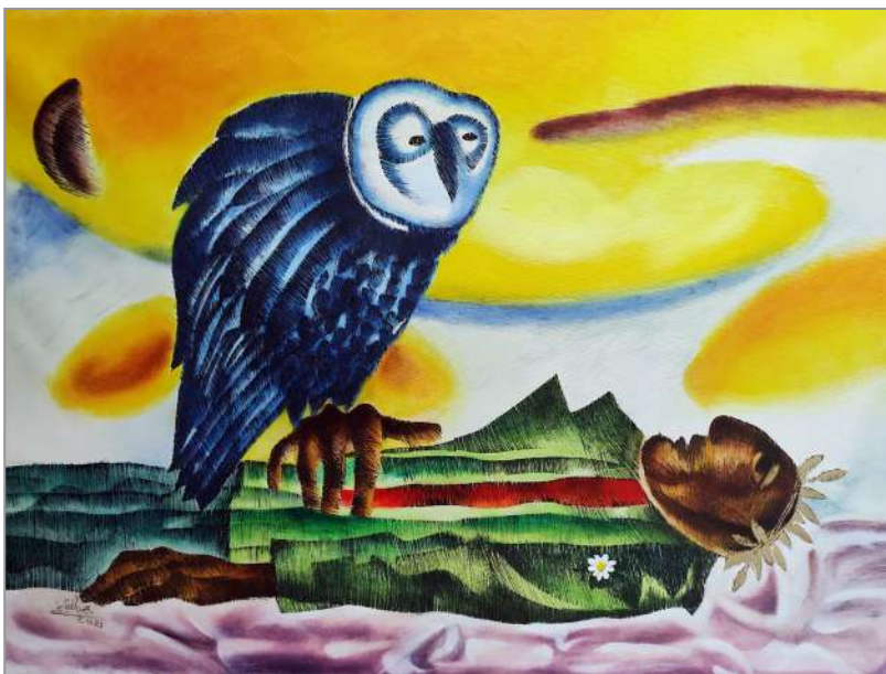
من مجموعة الاحلام 2021

وواضح وخيال جانح جنوح الاحلام. عانيت من أحلام اليقظة ومازلت تحت وطأتها وقساوة نفيها. جربت الرسم بمختلف الاساليب، والكتابة بصيغ عديدة، لانتهى في زورق بلا مجانيف! انها ليست جملة شعرية مجازية كما تبدو، إنما هي صيغة الوجود الفعلي حين يفقد المرء الحيلة والوسيلة للنجات في مكان واحد، ويعجز عن بلوغ القناعة ويكفر بنعمة الرضى، ولا يجني غير القلق الوجودي والشك... كلاهما نعمتي الفائضة الوحيدة... القناعة كفن فضفاض وبارد. لا أتق بمن وجد نفسه وقرر صيغته في مكان واحد، في كتاب واحد، في فلسفة واحدة، في اسلوب واحد، في قناعة واحدة، وفي امرأة واحدة.