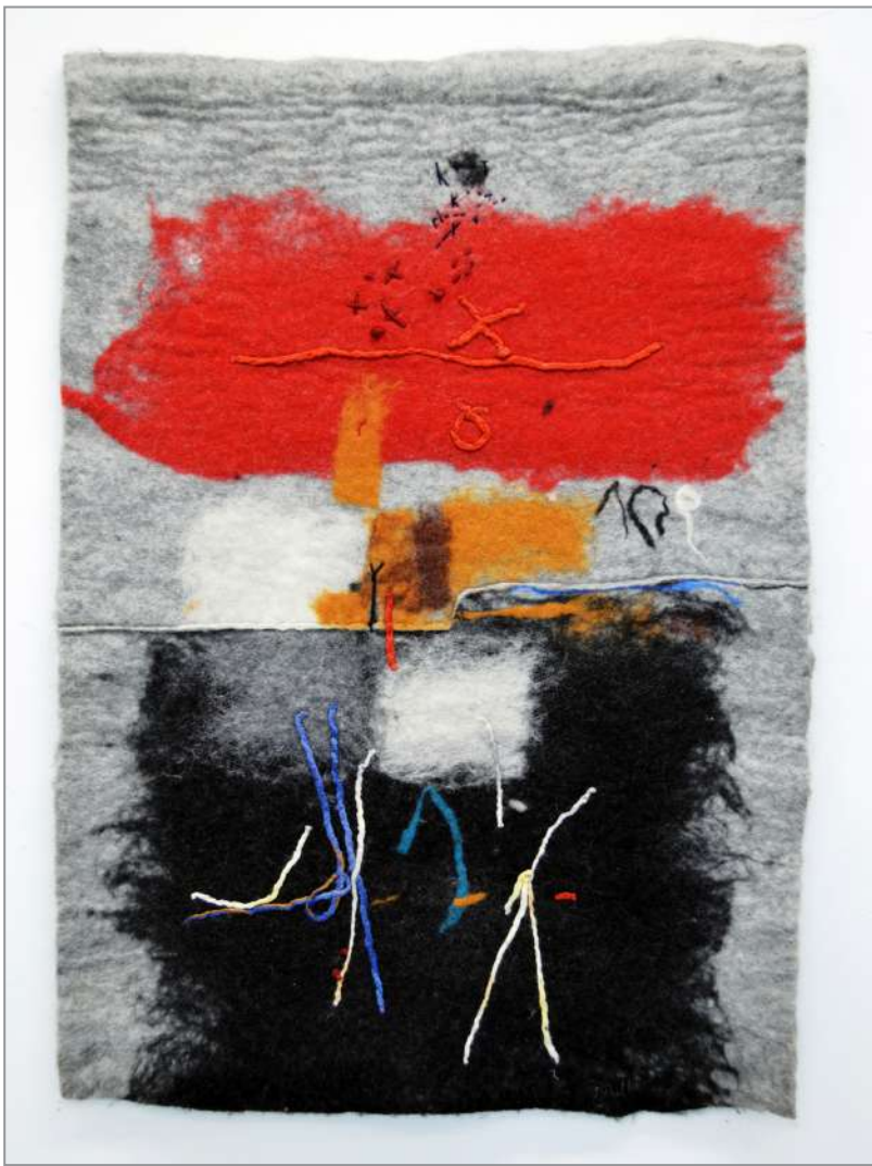
من مجموعة اشراقات 2002

- لايد أنها كانت ساعة مباركة في حياة أي حين سقط رأسي من رحمها، لكنها ولا ريب، أمست ساعة محنة يعتريني في الوجود المتزاي الأطراف من حولي. نشأت مبغض العواطف والاهتمامات، بين حضور الانشياء وغيابها، بين واقع صريح