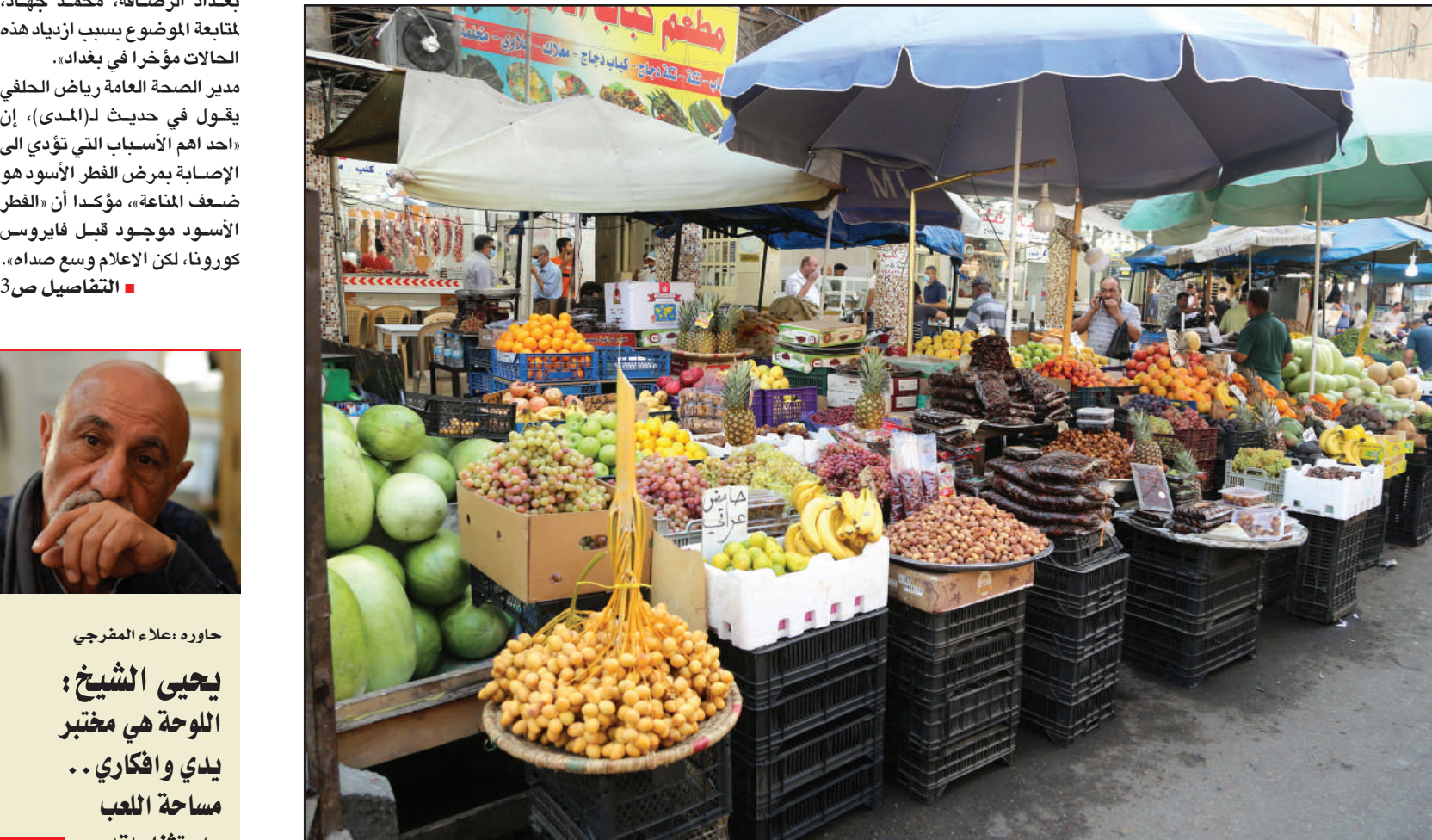
أسواق الخضار تنتعش بالمنتج الطهي..