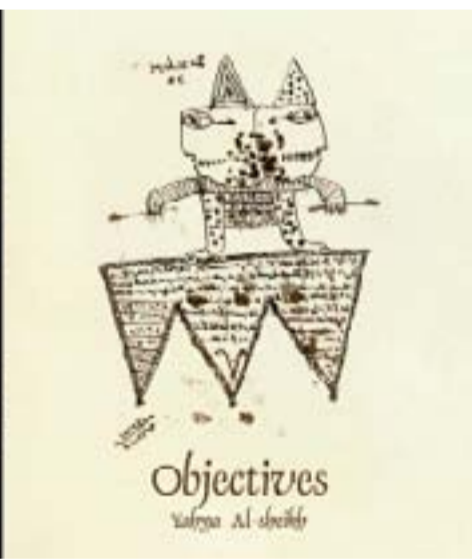
غلاف كتاب الغايات

بالضيق، الدراسة محل الانطباعات المباشرة. راح يجمع كل ما خلفه أجداده المندليون من رقى سحرية، وتواصل مع كتاب الموتى الصري على نحو يومي، ثم قرأ بإمعان كتاب شمس المعارف الكبرى للبولوني وهو من الكتب التي تجعل المرء يخشى من نفسه ومن العالم.