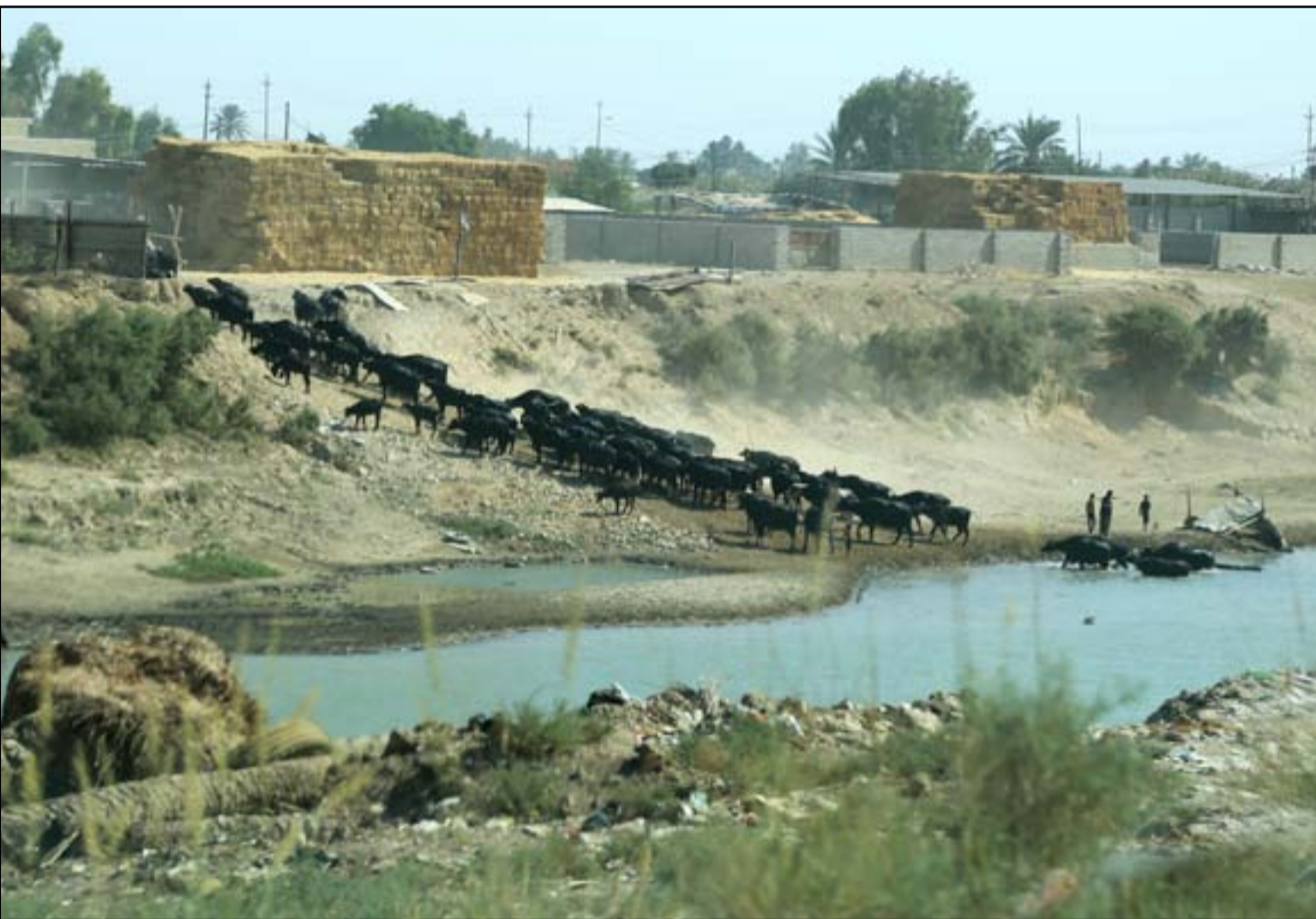
مفاوضات المياه التي اجراها العراق مع دول المنبع لم تأت بفائدة...

وعلى هامش هذا الملتقى ستكون هناك لقاءات ثنائية وثلاثية ورباعية بين السعودية وإيران والولايات المتحدة الأمريكية، وكذلك لقاءات بين تركيا والعراق، للباحث بشأن كل الخلافات وإمكانية تجاوزها. وأكد رحيم العبودي عضو الهيئة العامة لتيار الحكمة في تصريح لـ(المدى) أن