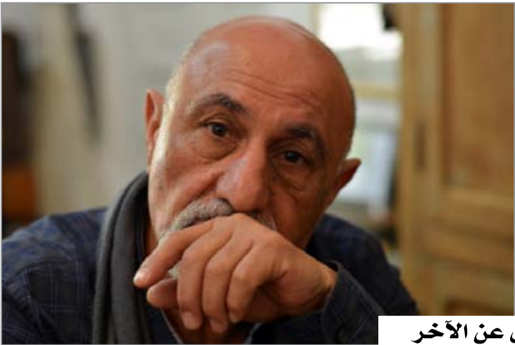
حاوره: علاء المرجعي

يرى طرائق جديدة للرسم وطرائق جديدة للكتابة وكلاهما لا يقومان بمعزل عن الآخر