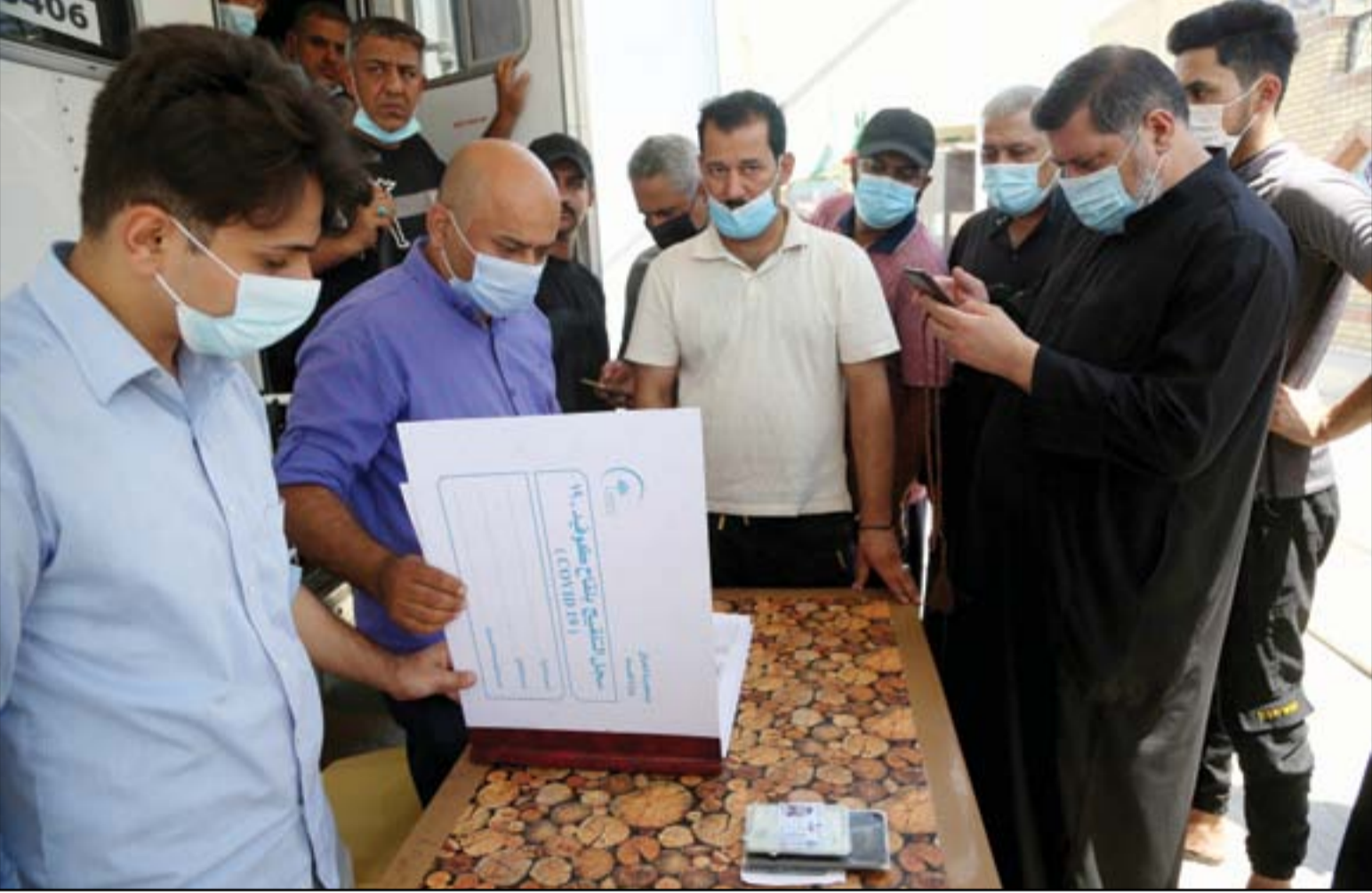
فرق جولة للتوقيع المواطنين في مدينة الصدر شرقى بغداد..

بغداد / تميم الحسن استبدلت اغلب الأحزاب الكردية المتنافسة في السليمانية ودهوك نوابها في قوائم الترشيح الجديدة لانتخابات تشرين المقبل. واعدت دهوك نائبين فقط، بينما استبدل احد الاحزاب كل نوابه الفائزين في 2018، وحولت احزاب اخرى نوابها الى الترشيحات الفردية. ويتنافس في المحافظتين التابعتين لإقليم كردستان 93 مرشحاً ضمن 8 دوائر خصصت للمحافظتين. ويبلغ مجموع مقاعد المحافظتين 29 مقعداً، مع اضافة مقعد واحد لدهوك و«كوتا المسيحيين» الذي يتنافس عليه 6 مرشحين. اجواء المنافسة في السليمانية هادئة، حيث يتنافس كل 7 مرشحين على مقعدين، إذ يبلغ عدد المرشحين 63 مرشحاً، فيما عدد المقاعد 18 مقعداً. في المحافظة الكردستانية هناك نحو مليون و400 الف ناخب يحق لهم التصويت، والمحافظة قسمت الى 5 دوائر. ورشح عن الدائرة الاولى المخصصة لها 4 مقاعد، 12 مرشحاً وهي دائرة مركز المدينة، فيما الدائرة الثانية والمخصصة أيضاً للمركز فترشح عنها 15، وتضم 3 المقاعد. الدائرة الثالثة، وهي دائرة حلبجة خصصت لها 3 مقاعد وترشح عنها 7 مرشحين فقط، والرابعة وهي دائرة دوكان وورانيا، فخصصت لها 4 مقاعد وورش عنها 14 مرشحاً. اما الدائرة الخامسة والاخيرة، وهي دائرة تضم مناطق جمجال، كفري، كيار، فخصصت لها 4 مقاعد، ويتنافس فيها 15 مرشحاً. ابرز المتنافسين في هذه المدينة هو حزب الاتحاد الوطني الكردستاني، صاحب المركز الاول في انتخابات 2018، حيث جمع حينها اكثر من 260 الف صوت. الحزب الذي يخوض الانتخابات تحت اسم تحالف كردستان، استبدل في هذه الدورة كل نوابه الـ 8 الفائزين في الانتخابات الماضية. التفاصيل ص 3