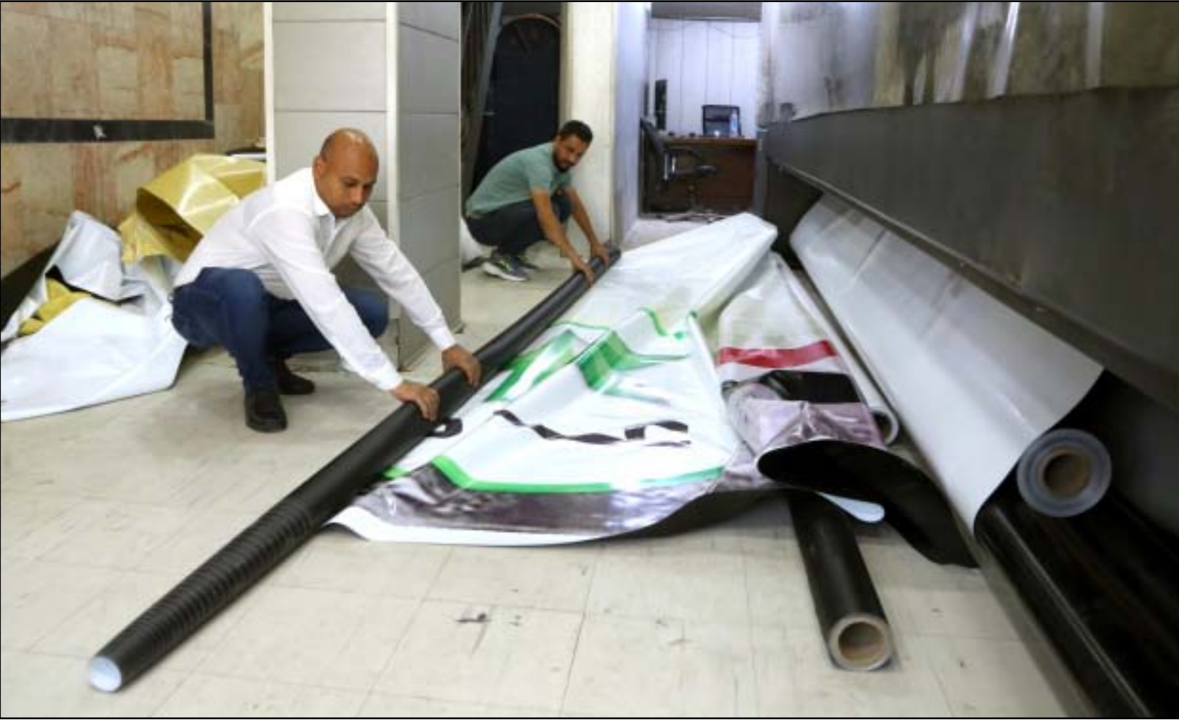
إطلاق الحملات الانتخابية..