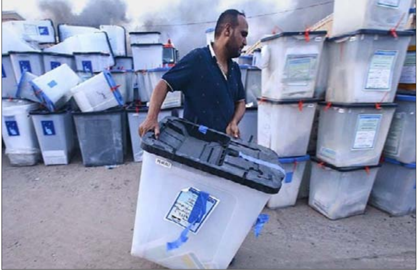
مخاوف من تهديدات السلاح المنفلت للانتخابات

من الأحزاب الجديدة المشاركة في الانتخابات هي حركة حقوق التابعة لكتائب حزب الله، والتي كانت في