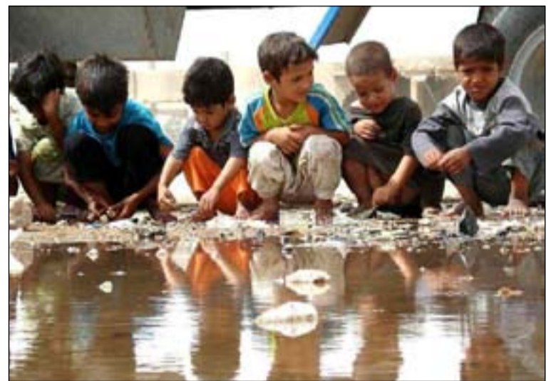
استمرار المعاناة بسبب الفساد

والاضطراب ازدادت في المحافظات الجنوبية وجوبهت بقوة وعنف من قبل القوات الأمنية". ولفت، إلى أن "انخفاض أسعار النفط أدى إلى تدهور اقتصادي حاد زاد من الاحتياجات الأكثر تضررا". ونبه التقرير، إلى "تضاعف عدد الأطفال الذين يعيشون تحت خط الفقر بنسبة ٣٨٪"، وعرج على "انخفاض أعداد وفيات الأمهات، بقيت نسبة معدلات وفيات الولادات الحديثة عالية (بحدود ٥٦٪ وفيات دون الخمسة أشهر)". وذكر أيضا، أن "هناك ٢٠٠,٠٠٠ ألف طفل حديث الولادة لم يحصل على لقاحات إنقاذ حياة ضد أمراض أطفال وبخصوص الجانب التربوي للأطفال وحرمان كثير منهم من دخول المدارس ومواصلة الدراسة، أشار التقرير إلى أن "وباء كورونا والنزوح تسببا بوجود ١,٣ مليون طفل من العائدين يواجه عقبات وعراقيل في الحصول على التعليم". واستطرد، أن "هناك ما يقارب من ١,٧ مليون شخص يعيش حالة نزوح".