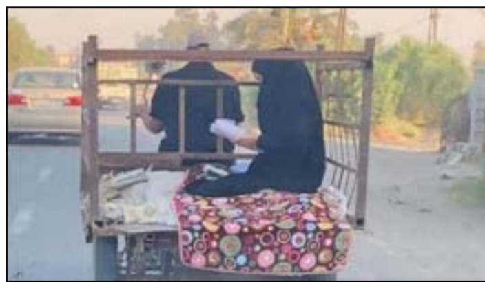
التقط الصورة لي لوالدي، عندما كنت ذاهبة لتقديم الامتحان، كون العربية مكشوفة تماماً لكافة السيارات المارة بسبب احوال عائلتها المالية انقطعت من حولنا، وفجأة انتشرت صورتي في كامل العراق، وازدادت سارة انها بسبب احوال عائلتها المالية انقطعت

والباحث منتقد داغر عبر حسابه على تويتر "هذه الطالبة التي انتشرت صورتها، وهي متجهة لامتحان البكالوريا (الثانوية العامة) ببغداد على ستوة والدها، تعبير حقيقي عن إصرار إلى مدرسة مبنية من الطين".