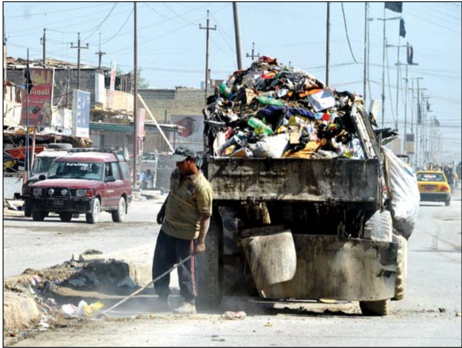
الحلة تشكو من أزمة نفايات خانقة.. والبلدية: السبب قلة أعداد عمال النظافة.. عسدة: محمود رؤوف

حل كل الخلافات. وتأتي هذه التصريحات فيما كان المبعوث الأميركي قد كشف، مؤخراً، عن الخطوات التي يمكن أن تقدم عليها بلاده في حال توصل الاتفاق إلى جدار مسدود. وأوضح مالي أن الولايات المتحدة يمكن أن تقدم على اتفاق منفصل مع إيران في تلك الحالة، لكنه سيكون مختلفاً تماماً عما يتضمنه الاتفاق النووي الحالي. والمستوى الآخر، حسب المبعوث الأميركي، يتعلق بحزمة من الردود العقابية التي قد تطال إيران، على أن يجري الاتفاق عبرها مع الحلفاء الأوربيين، فيما رفض تحديد نوعية تلك العقوبات. وجررت المفاوضات النووية بين إيران والمجموعة الدولية في العاصمة النمساوية فيينا، وشاركت فيها الولايات المتحدة بشكل غير مباشر.