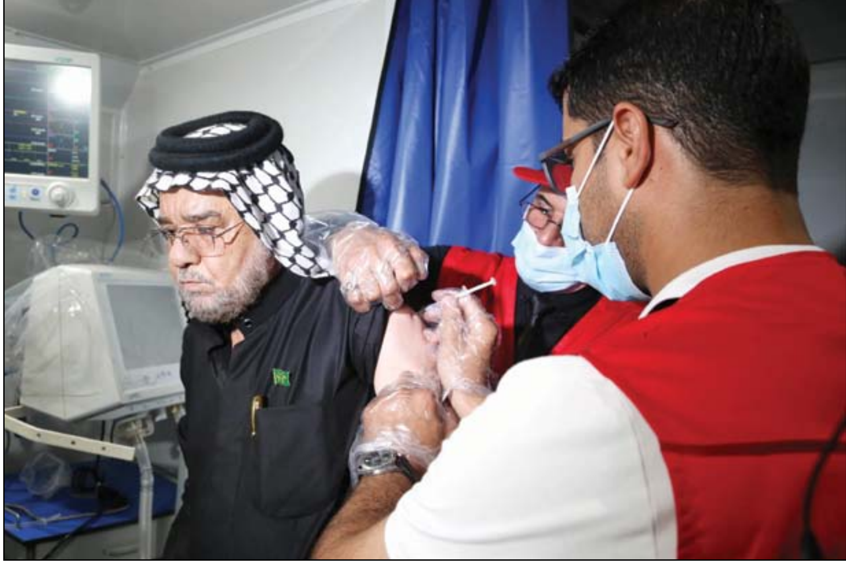
لجنة الصحة والسلامة تحذر من التراخي في اخذ اللقاحات...

والذي يقدر بحدود (910) مليون دولار سنويا بين البلدين من خلال إعادة فتح عدد من المنافذ الحدودية الجديدة، وتفعيل ملف استثمار الأراضي الصحراوية. وتعليقا على هذا التقارب اعتبر يونادم كنا رئيس كتلة الرافدين البرلمانية ل(المدى)، أن "عودة العلاقات العراقية السعودية إلى ما كانت عليه في السابق أمر لا بد منه". وأضاف كنا، أن "أمن المنطقة مشترك بين دولها، ويتطلب تضامير الجهود مللاحقة جميع العناصر الخارجة عن