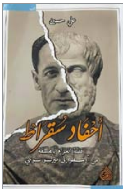
علي حسين ينّبّه القارئ أن تعثروا بفلسفة كانط. في أن هيغل في كتابه (ظاهريات الروح) كان يهدف إلى الارتقاء بالعنصر الفلسفي

مع اطلاعي على العديد من أعمال ديلان، الا أنني أشرت أن احصر معانيي بهذا العمل فقط. فهو برأي يشكّل مفتاح الدخول لبقية أعماله، سواء كانت مواصلات تركيبية، أو رسوم، أو فواتر فنية. بما أنه وفي كل أعماله مفتون بملونته البيئية، وفي اخراج أفكاره التسبيقية غالبا غير بعيد عن هذا الإرث اجتماعيا وسياسيا. كما أنني اعتبر هذا العمل بمائة انشاءه المألوفة، الفعيرة والمتداولة والمبتذلة أحيانا، شكل دعوة لغيرة من التشكيليين ليجنوا جنوه. وأنا أعرف ان العديد من تشكيليينا في وقتنا هذا انبهوا لهذا اشتغالات متربالية مهلهة. هي أيضا دعوة للخروج من فضاء صالات العرض الى فضاء المدن. وربما لمناسبة، أو حتى بغير مناسبة. ولو من أجل اشاعة ذائقة فنية جديدة كتكتسب أهميتها من كونها جزء من فضاءات محيط وبيئة المدينة والفضاءات البيئية الأخرى.