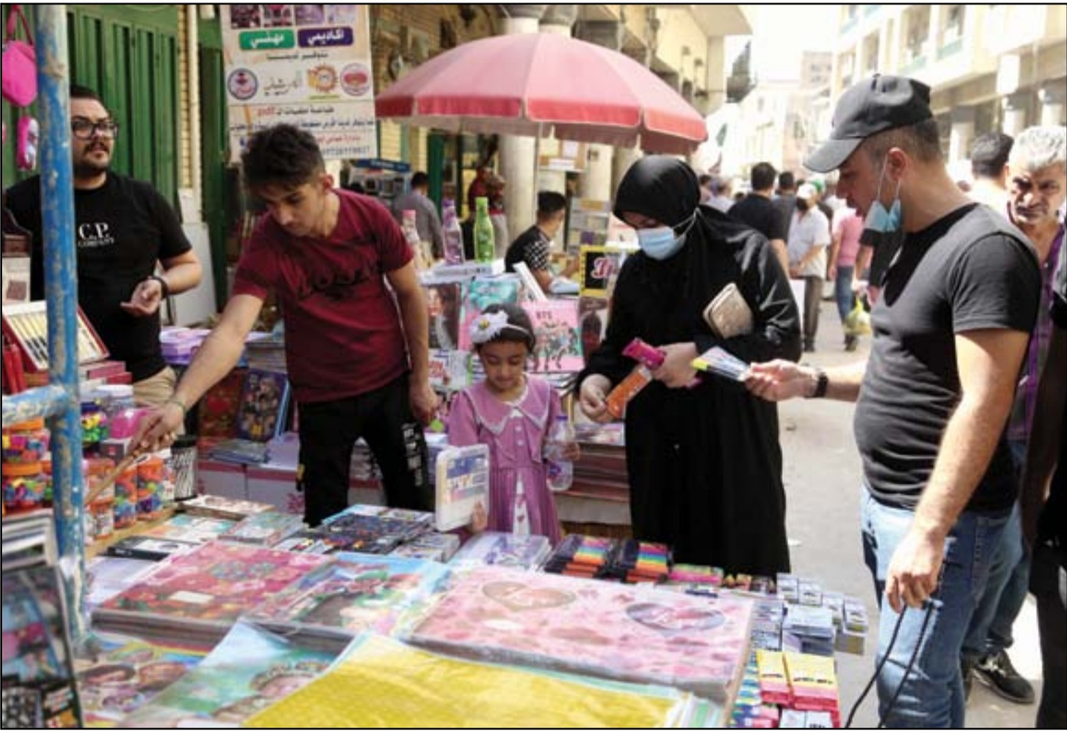
غياب الدعم الحكومي للقرطاسية المدرسية تسبب في ارتفاع اسعارها ...