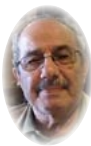
■ ترجمة: عادل حبه

في حدوث بعض التوتر في العلاقات بين طالبان وداعش.