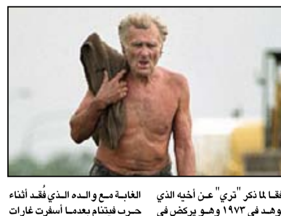
الغابية مع والده الذي فقد أثناء حرب فيتنام بعدما أسفرت غارات شوهه في 1972 وهو يركض في

القصف عن مقتل زوجته واثنين آخرين من أبنائه، وكان الأب الذي توفي قبل 4 أعوام، يقاتل الى جانب قوات فيتنام الشمالية ذلك الوقت، عندما ضربت قبيلة منزله، فظنوا أنه فارق الحياة، إلى أن عثروا عليه وعلى ابنه في آب 2013 بالغابة التي عاشا فيها منذ اختفى أثرهما في 1972 ولم يكن لديهما أية فكرة عن انتهاء الحرب.