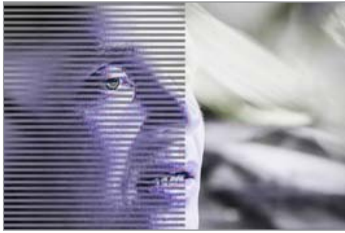
بيترى بويكولاينين في لقطة من الفيلم