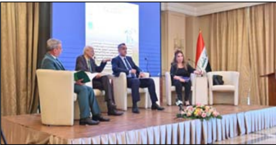
بدوره، قال وزير الثقافة الدكتور حسن ناظم: إن الوزارة تؤسس لعهد جديد يختلف تماماً عن ما كانت عليه سابقاً، فهي لم تعد وزارة مهرجانات وانشطة فقط كما كانت عليه الأحوال بعد

انطلقت في بغداد امس الأربعاء فعاليات مؤتمر العلوم الاجتماعية والإنسانية /دورة العلامة الراحل علي الوردي بحضور رئيس مجلس الوزراء مصطفى الكاظمي، ووزير الثقافة الدكتور حسن ناظم، وبمشاركة نخبة من الباحثين والأكاديميين، ويستمر المؤتمر لمدة يومين.