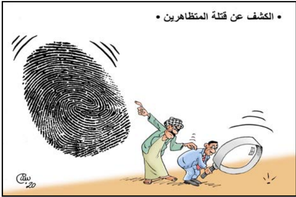
الكشف عن قتل المتظاهرين