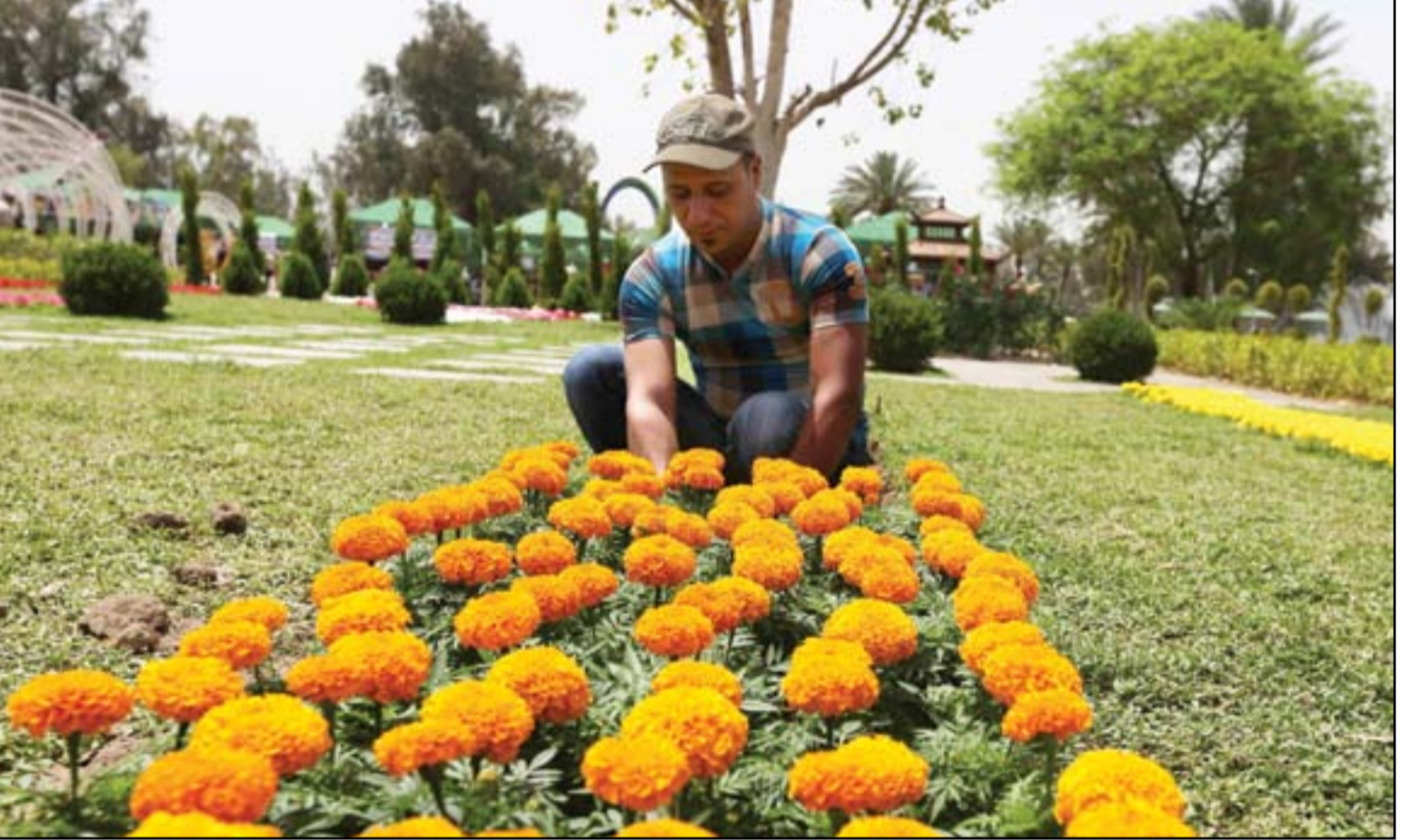
عامل يزرع الزهور في الحدائق العامة في بغداد..