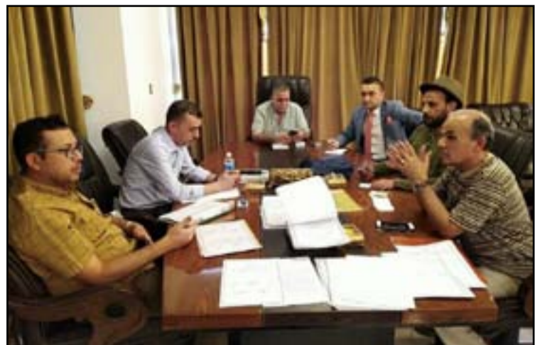
منتصف ٢٠١٩ اختارت اللجنة مشاريع سينمائية لغرض الإنتاج، وكان من المقرر أن تنتهي أعمالها في ٢٠٢٠ ولكن لأسباب