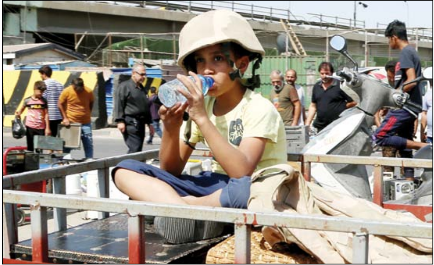
ينتظر رزقة في حر لاهب...