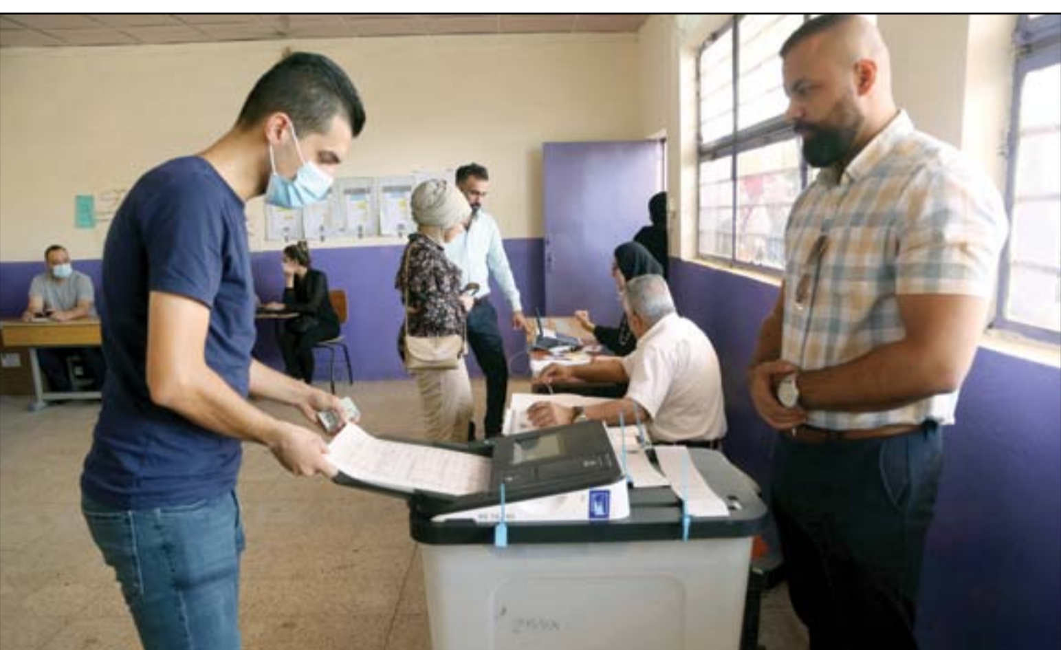
بغداد تشهد ممارسة انتخابية تجريبية استعداداً لانتخابات تشرين.. عسة: محمود رؤوف