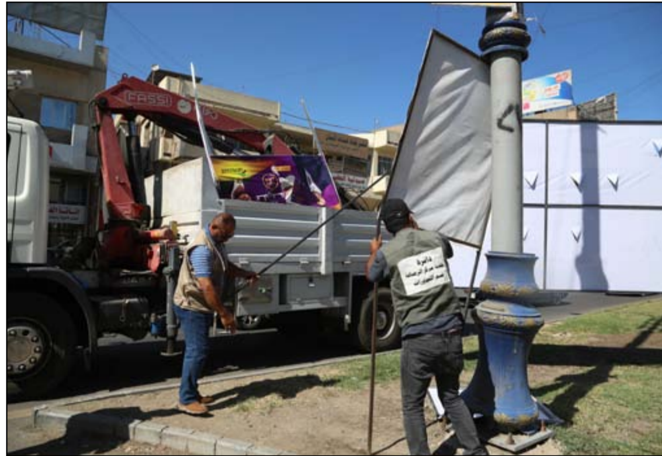
امانة بغداد تزيل تجاوزات الدعاية الانتخابية على الارصفة والجزرات الوسطية .. عدسة: محمود رؤوف

أكد موقع بريطاني إخباري عدم حصول تغيير جذري في العراق بعد