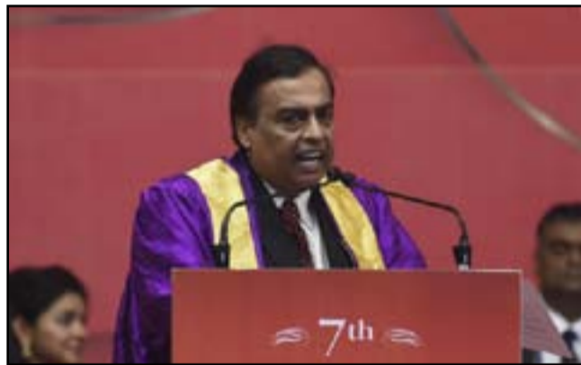
إيلون ماسك ٢٢٢ مليار دولار، جيف بيزوس ١٩١ مليار دولار، برنارد إيلون ماسك ٢٢٢ مليار دولار، جيف بيزوس ١٩١ مليار دولار، لاري بيغ ١٢٥

مليار دولار، مارك زوكربيرغ ١٢٣ مليار دولار، سيرغي برين ١٢٠ مليار دولار، لاري إيلسون ١٠٨ مليار دولار، ستيف بالمر ١٠٦ مليار دولار، وارن بافيت ١٠٣ مليار دولار، موكيش أمباني ١٠١ مليار دولار. جميع أعضاء القائمة من الأمريكيين باستثناء أرنو، وهو فرنسي، إلى جانب أمباني الهندي، كما أن جميعهم تقريبا جمعوا ثروتهم من أعمال التكنولوجيا، باستثناء أرنو الذي يعمل في مجال السلع الاستهلاكية والموضة، وبافيت الذي تتنوع استثماراته في مجالات عدة. أما أمباني، فقد ورث أعمال والده