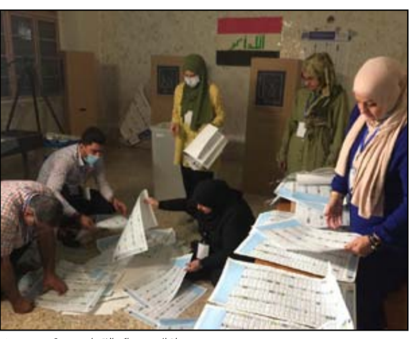
لقطات من مراكز الاقتراع..