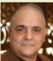
صراحة، لسّمت مع الداعين إلى تغيير المدرب سوكون ببديل وطني، فهذه الفئة بالذات عانت كرتنا منها ما بين شهادت الزوير لمدربين فاضلين، والتلاعب، والضغط الحزبية. . .