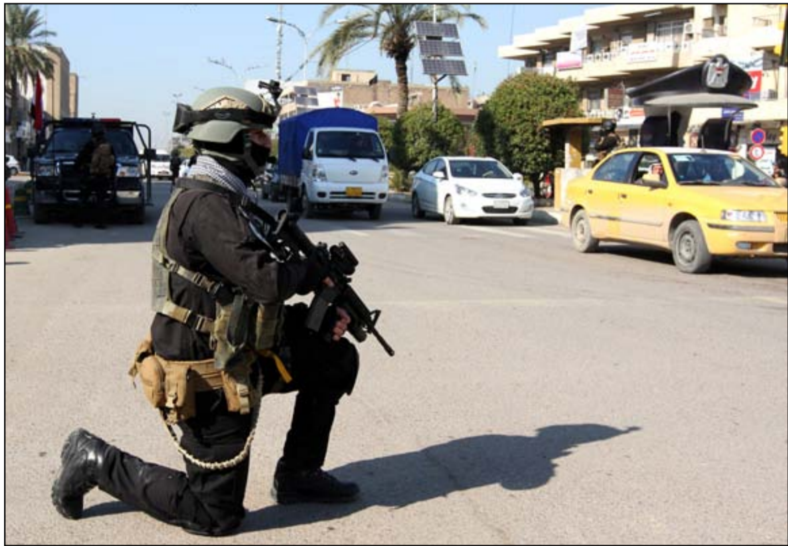
قوات مكافحة الارهاب تنتشر في محيط المنطة الخضراء لحماية صناديق الاقتراع ..