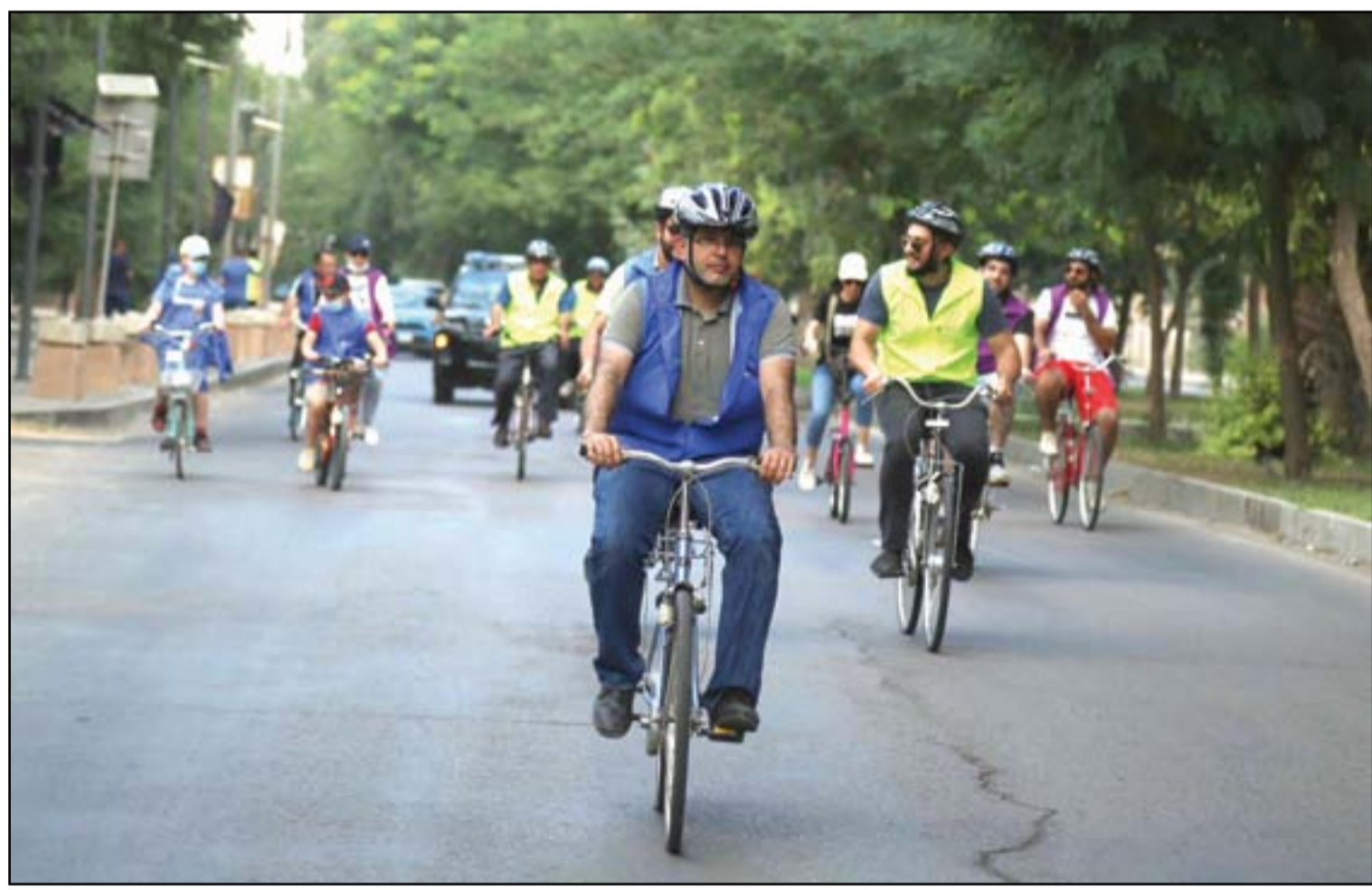
يوم القلب العالمي... ماراثون للدراجات الهوائية على شارع أبي نؤاس بمبادرة من نقابة الأطباء... عسدة: محمود رؤوف

7 نطفية الدليمي تكتب، ساباتو بين سحرين : الرياضيات والسريالية