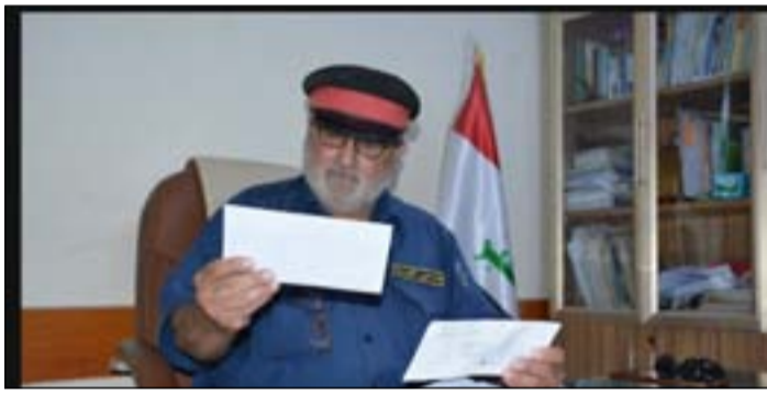
مواطن بصري صاحب مكتب عقارات في البصرة. وعندما توجهت إلى مكتبه من أجل إعطائه البريد، رحب بي ولكن

الرسالة: إذا كانت تتضمن تعويضا عن سيارتي التي دهستها مدركات القوات البريطانية، فسوف أكرمك. وإن كان عكس ذلك، فسوف أعطيك قرح ماء وأقول لك مع السلامة. وقبل أن يفتح الرسالة، قلت له: إكرام الضيف واجب؛ فأكرمني بقدر ماء ووقع لي على وصل استلام الرسالة. تعلمت عمل الخريدون مقابل. تقول الباحثة في التراث الاجتماعي نوال جويد إن "عمل ساعي البريد انحسر في الوقت الحاضر، وأصبح من المهن القديمة بسبب تطور وسائل التواصل وسرعته؛ فلم تعد تنتظر الرسائل الورقية ولا تكتبها، إذ كانت تبقى لأشهر في صناديق البريد حتى تصل إلى وجهتها. أصبح