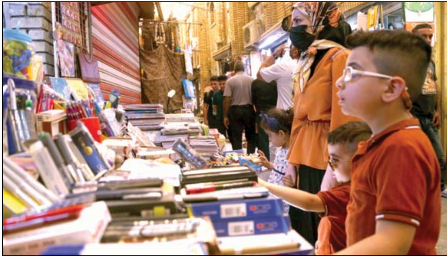
ارتفاع الإقبال على شراء القرطاسية مع قرب حلول العام الدراسي الجديد.. عديسة: محمود رؤوف

الوزارة لفتت الى ان دخول العراق بموجة رابعة أمر بديهي ومنطقي وحتمي مع استمرار