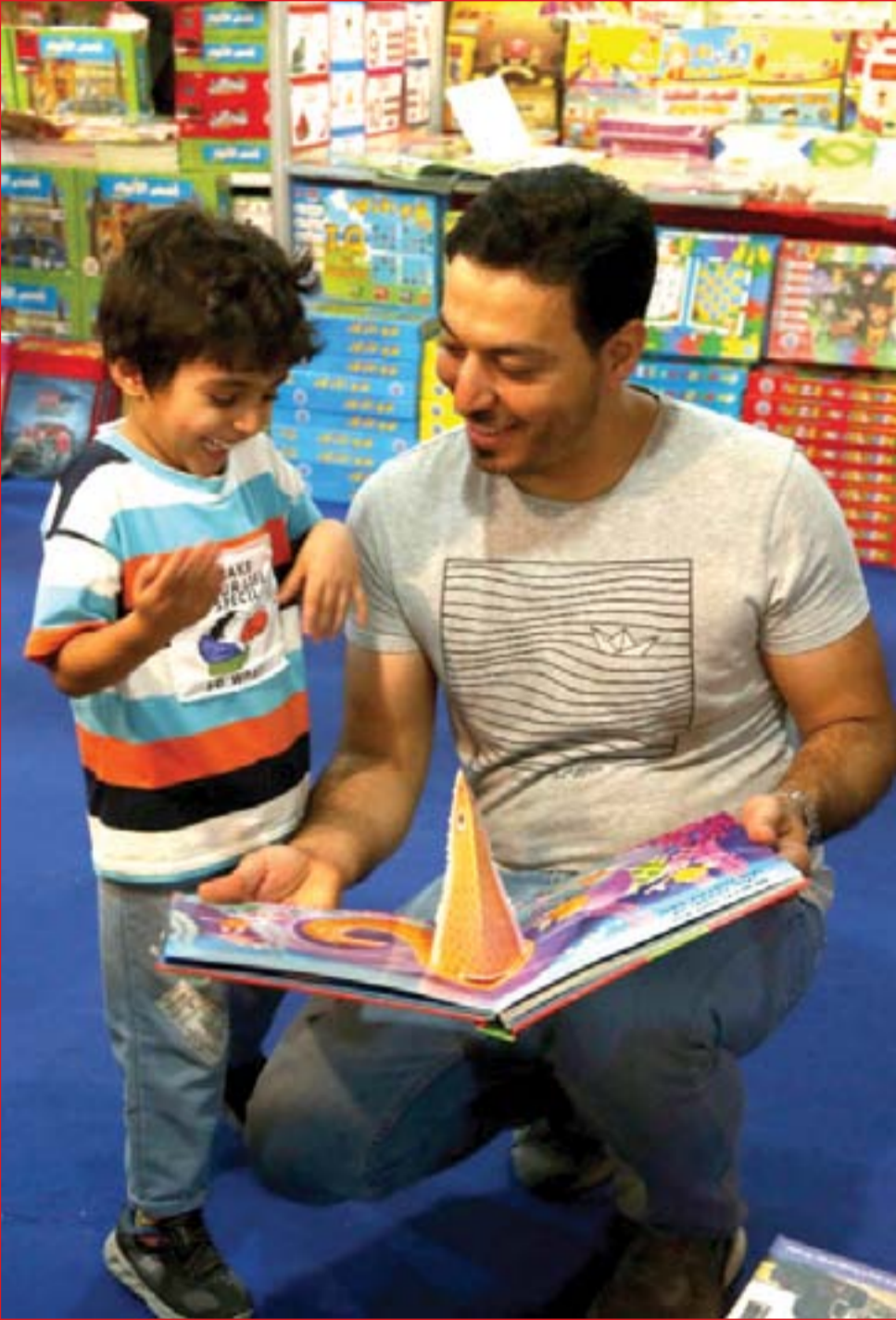
كتب الاطفال تلقى رولاً في معرض البصرة الدولي للكتاب..