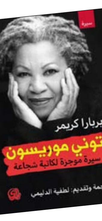
بربارا كريم توني موريسون سيرة موهجة لكاتبة شجاعة

لم تعلن عنه، وقد بلغت 88 من العمر. في عام 1996، اختارها الصندوق الوطني للعلوم الإنسانية للمشاركة في محاضرة جيفرسون، وهي أعلى وسام تكريم للحكومة الفيدرالية الأمريكية في مجال العلوم الإنسانية. في نفس العام، تم تكريمها بميدالية المساهمة المتميزة في الأدب الأمريكية من مؤسسة الكتاب الوطنية. في 29 مايو 2012، قدم الرئيس باراك أوباما لموريسون وسام الحرية الرئاسي. في عام 2016، حصلت على جائزة القلم للإنجاز في الرواية الأمريكية. في عام 2020، تم إدخال موريسون في قاعة مشاهير النساء الوطنية. لعبت موريسون دوراً حيوياً في إدخال الأدب الأسود في الاتجاه السائد. وكان من أوائل الكتب التي عملت عليها كتاب الأدب الأفريقي المعاصر الرائد (1972)، وهو مجموعة تضمنت أعمال الكتاب النيجريين، وول سويتكا، وتشينوآ تشيبي، والكاتب المسرحي الجنوب أفريقي أنول فوجارد. وقالت إنها عززت جيل جديد من الأفرو-