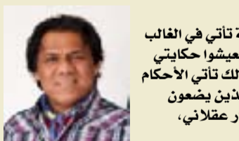
أردت أن الظنون السيئة تأتي في الغالب من الأشخاص الذين لم يعيشوا حكايتي ولم يمشروا بتجربتي، كذلك تأتي الأحكام الجاهزة من الأشخاص الذين يضعون سدود الوهم أمام كل حوار عقلائي،

أمريكية الكتاب، بما في ذلك الشاعر والروائي توني كيد اليامبارا، والنشطة أنجيلا ديفيس بالإضافة إلى ذلك، نشرت وروجت لأعمال هنري دوماس، الروائي والشاعر غير المعروف الذي قتل عام 1968 برصاص ضابط شرطة في مترو أنفاق مدينة نيويورك. بدأت موريسون كتابة الروايات الخيالية عندما كانت مشتركة مع مجموعة من الكتاب والشعراء في جامعة هاوارد الذين كانوا يلتقون ويناقشون أعمالهم. في أحد المرات ذهب مورسون إلى الاجتماع والتي تحمل عنوان "العين الأكثر زرقة" التي نشرت عام 1970. كتبت موريسون هذه الرواية في الوقت الذي كانت ترمي طفلها وتعمل في جامعة هاوارد. في عام 2000 اختيرت هذه الرواية كأحد مختارات نادي أوبرا للكتاب. في عام 1975 رشحت روايتها "صولا" التي كتبتها عام 1973 لجائزة الكتاب الوطنية، أما روايتها الثالثة "نشيد سليمان"، فقد اختيرت كتاب الشهر وهي رواية لكاتب أسود يتم اختيارها بعد رواية الكاتب ريتشارد رايت "الابن البدي"، التي اختيرت عام 1940 وقد حصلت أيضا على جائزة النقد الوطنية. في عام 1987 شكلت روايتها "محبوبة"، نقطة حرجية في تاريخ نجاحها عندما فشلت في الفوز بجائزة الكتاب الوطنية وجائزة النقاد الوطنية مما حدا بعدد من الكتاب إلى الاحتجاج ضد إغفال موريسون، ولكن بعد عدة قصص قصيرة فازت هذه الرواية بجائزة بوليتزر عن فئة الأعمال الخيالية وبجائزة الكتاب الأمريكي. في نفس السنة عملت موريسون أساتذة زائرة في كلية بارد. في عام 1998 تحولت هذه الرواية إلى فيلم يحمل نفس الاسم من بطولة أوبرا وينفري ودان كلوفر. رشحت، دورية نيويورك تايمز للكتب هذه الرواية في عام 2006 كأفضل رواية أمريكية نشرت خلال الخمس وعشرون سنة الماضية.