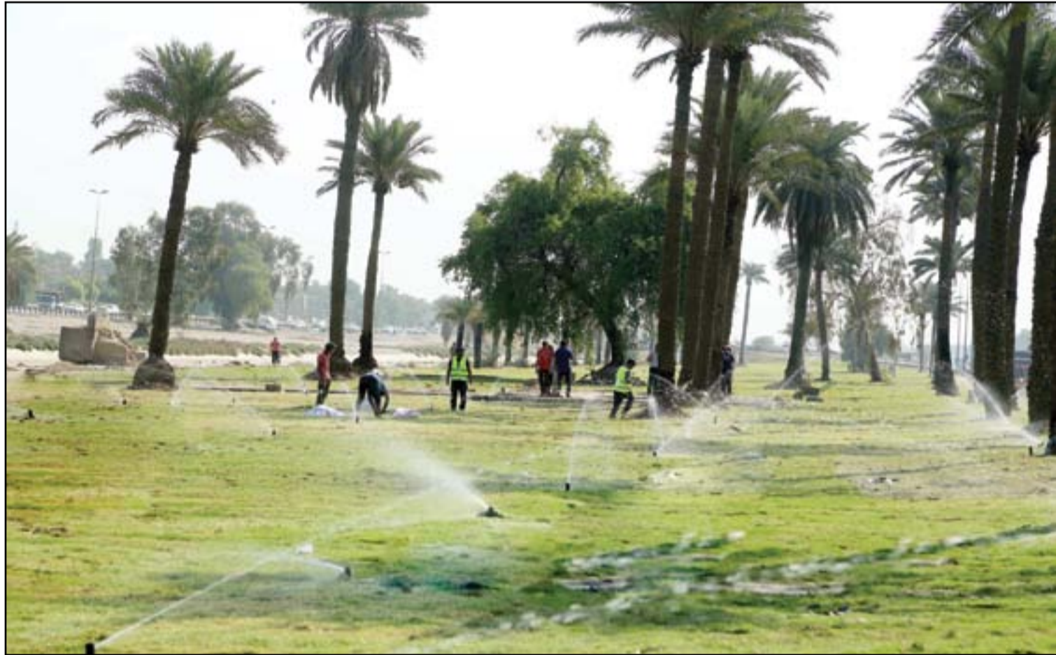
المباشرة بتأهيل مشروع قناة الجيش في بغداد...