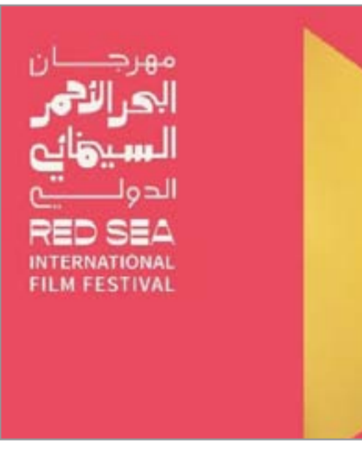
مهرجان البحر الأحمر السينمائي الدولي