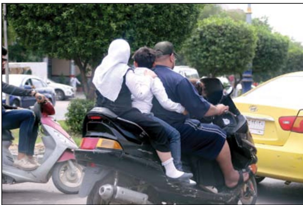
أب يوصل أطفاله الثلاثة إلى المدرسة بدراجة نارية.. عذسة: محمود رؤوف

أسبوع مر على حادثة "نهر الإمام" في شمالي بغداد ولا يوجد متهمون حتى الآن بالهجوم الذي تسبب بمقتل واصابة نحو 30 مدنيا وإخلاء القرية بالكامل. وتمنع تدخلات "سياسية" و"عشائرية" من توجيه الاتهامات إلى أي أحد، حتى الذين تم امسكهم بـ"الجرم المشهود". وتحاول أطراف في ديالى قرية من "الحشد" تخفيف حجم الاضرار وعدد الضحايا في القرية، كما تدعم رواية مسؤولية "داعش"، وهي خلاف ما يقوله شهود العيان.