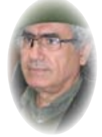
■ رشيد الخيون

تعرضت قريتا «الرُشاد» و«نهر الإمام» (٢٧ أكتوبر ٢٠٢١)، من قرى محافظة ديالى، إلى مجازر. فجزرت داعش (السُّنيّة) «الرُشاد» (الشيعية)، والإرشاد ردت بمجزرة على «نهر الإمام» (السُّنيّة). وهكذا أعلنت وسائل الإعلام، وأرادت الجماعات المسلحة، وهكذا تعيش ديالى. ظلت خاصرة العراق نازفة خلال الحرب الإيرانية العراقية (١٩٨٠-١٩٨٨)، وبعد ٢٠٠٣، لم يتوقف نزيها حتى اللحظة، يتهارش داخلها الطائفون. وهي المنطقة التي كانت متسعة للجميع، على اختلاف المذاهب والقوميات. إذا عينت خريطة العراق تجد ديالى محاصرة، من جهة الشرق، والمنطقة المفتوحة على إيران وما بعدها، مع تداخل في الجبال والمياه. لا تصل خيول الغزاة صرة العراق بغداد إلا بعد وطء الخاصرة. مرت منها إلى بغداد جيوش الغنّار (٦٥٦هجريّة)، ثم جرت الحروب بين العثمانيين والصفويين عليها والغالب ينتزع بغداد، قبلها بقرون مرّ منها أصحاب الرّايات السود (الدعوة العباسية ١٢٢ هجرية)، ثم جيش عبد الله المأمون (١٩٦-١٩٨ هجرية) في حرب الأخوين الشهيرة ببغداد، يقع وراء ديالى، داخل الأرض الإيرانية بمحلة، قصر عُرف في التاريخ بصغر اللصوص (البنساري، أسنن التّقاسيم)، وهو اليوم قصر شيرين. من كان يحسب أن مدينة المقداديين وأسماها السّابق «شهربان» أم بساتين الرُمان، تجند النساء منها انتحاريات؟! وتعرض إلى مقاتل فظيعة، حدث ذلك بها، عندما حطم الغزو الأمريكي (٢٠٠٣) أسوار العراق، القوات المسلحة كافة، نكرها أبو حنّان النّوحدي(ت: ٤١٤ هجرية)، قائلا: «هل تسمع في سواد أصبهان ما يشبه البردان، والرادان، والنهروان... وباعقوبا وشهربان؟! (الرّسالة البغداديّة). كان لشهربان أو المقدادية، تاريخ غابر، في ما جرى بين الخلافة العباسية وسلطنة السلاجقة أيضاً، نكر يومياتها صاحب «الكامل في التاريخ»، في حوادث