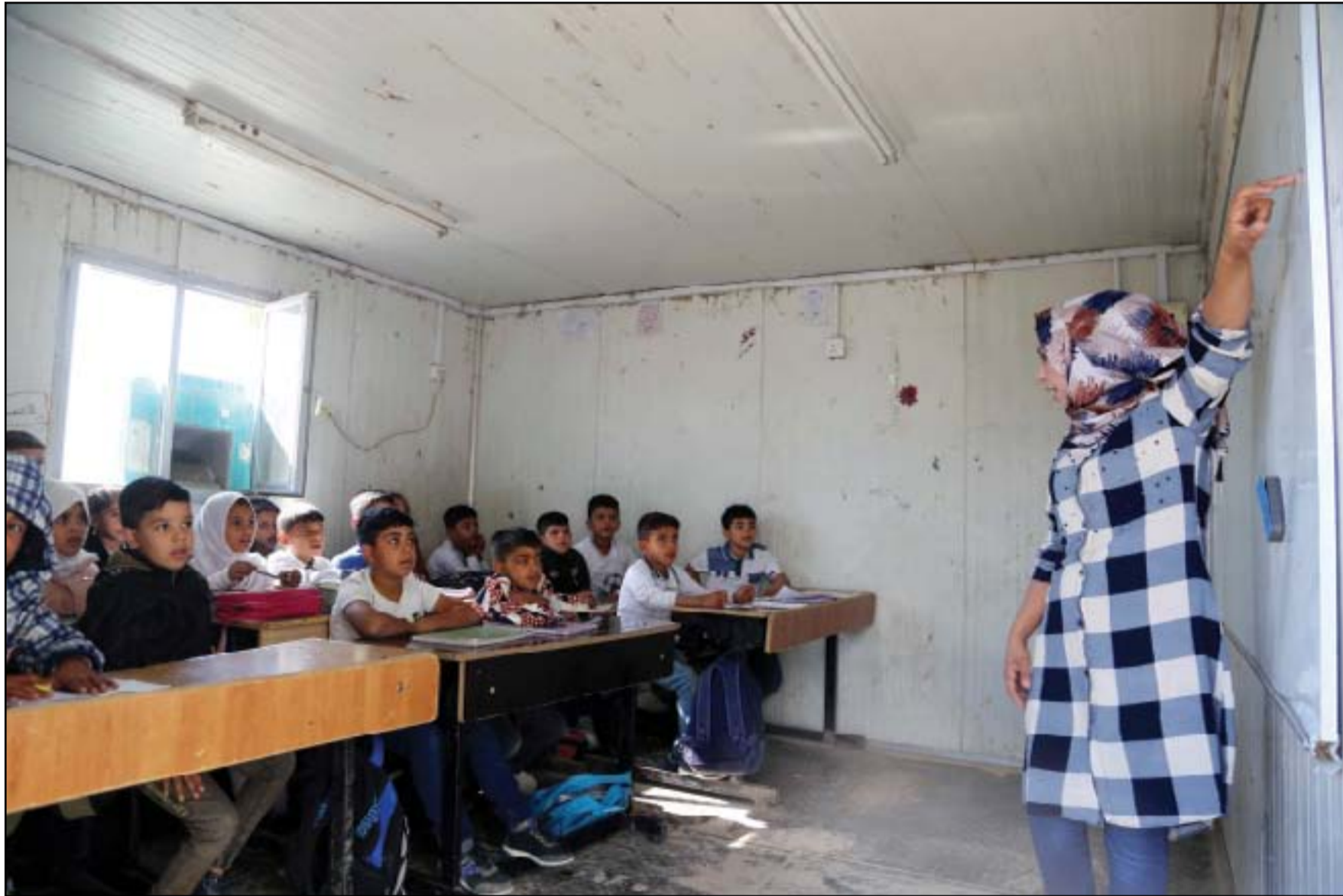
مدرسة الرسالة المحمدية في المدائن، تتحول إلى (كرفانات) بعد هدم مبناها بداعي إعادة الأعمار..

بغداد/ فراس عدنان لم تزل الكتل السياسية السنية والكرديّة بانتظار وصول البيت الشيعي إلى توافق بشأن الحكومة المقبلة، وذلك التوافق لا يبتعد عن حسم الطعون على نتائج الانتخابات، ولعل خيار التوافقية بدأ يفرض نفسه بقوة على الساحة، مع