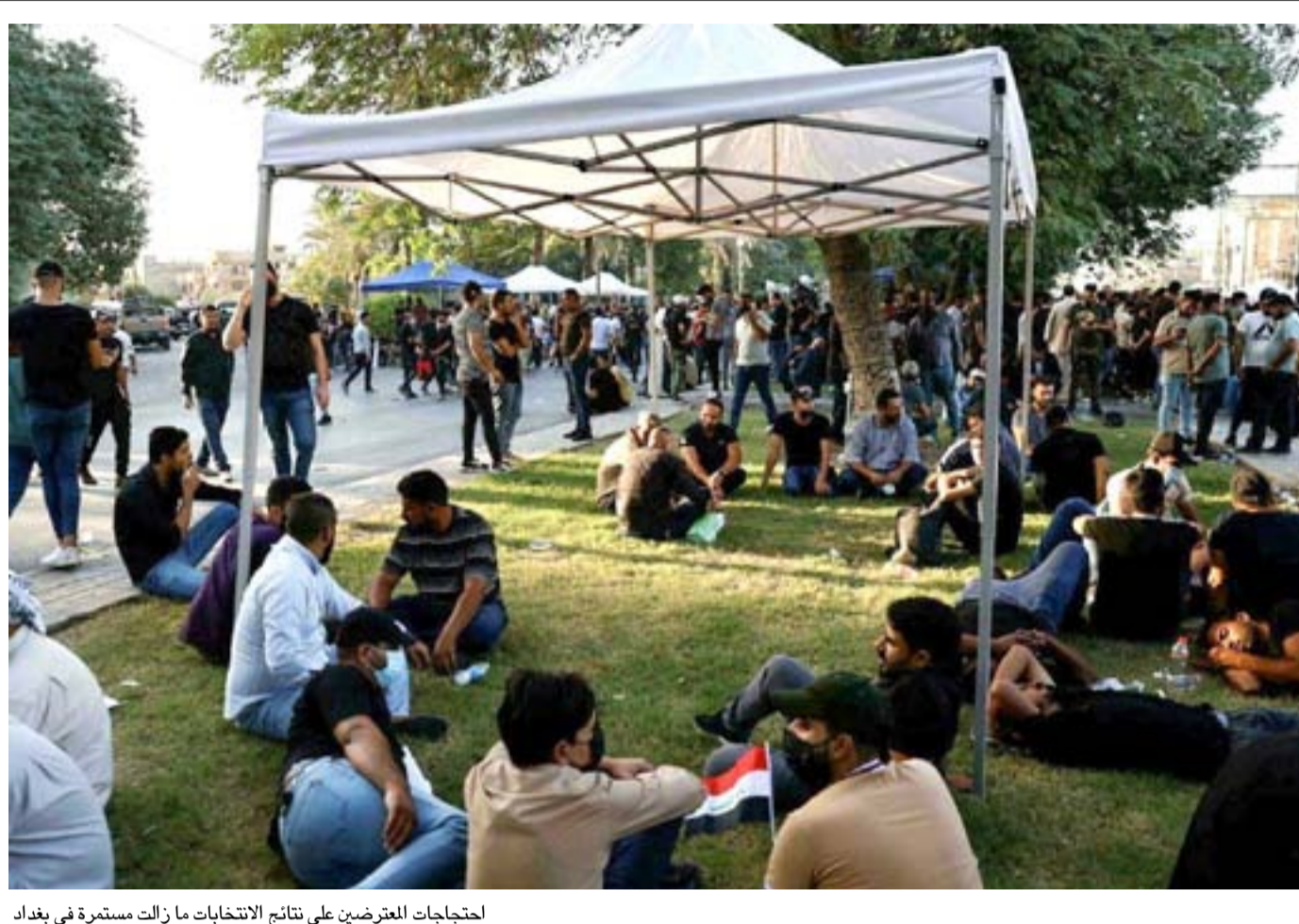
احتجاجات المعارضين على نتائج الانتخابات ما زالت مستمرة في بغداد

ومن المتوقع أن تنهي الهيئة القضائية في محكمة التمييز الاتحادية خلال أيام النظر في الطعون على نتائج الانتخابات، لكي تتم بعدها المصادقة وتبدأ المدد الدستورية الخاصة بتشكيل الحكومة وسط حالة من الانقسام السياسي داخل البيت الشيعي بين التيار الصدري والإطار التنسيقي.