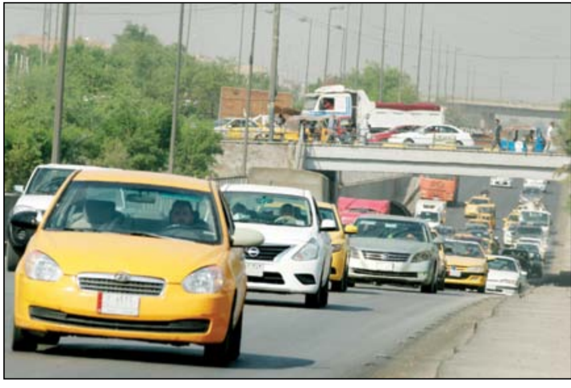
دوام المدارس والجامعات يقاوم الزحامات في العاصمة وسط غياب الحلول .. عدسة: محمود رؤوف