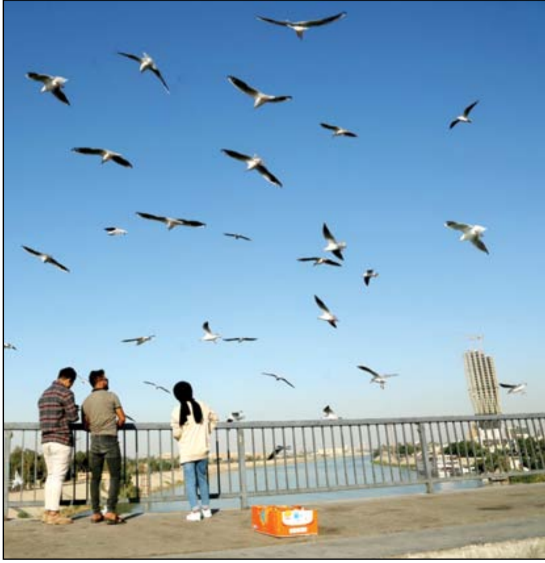
بغداديون يطعمون النوراس على جسر الجادرية..

أكد وزير الكهرباء عادل كريم، أمس الاربعاء، أن العراق بحاجة ماسة الى استيراد الغاز الإيراني لسد حاجة البلد من الطاقة الانتاجية على مدى 3 سنوات، مبيناً ان العراق بحاجة الى انتاج 15 الف ميغاواط من هذه الطاقة. وقال الوزير لـ(المدى)، إن "زيارتنا الى كركوك كانت بتوجيه مباشر من قبل رئيس الوزراء مصطفى الكاظمي، للوقوف على المشاكل التي تعاني منها المحطات الكهربائية ومنها محطة الدبس شمال غرب كركوك، كما تدارسنا الاختناقات ومشاكل التجهيز في اقضية داقوق والديبس ومحطات الانتاج". وأضاف أن "رئيس الوزراء