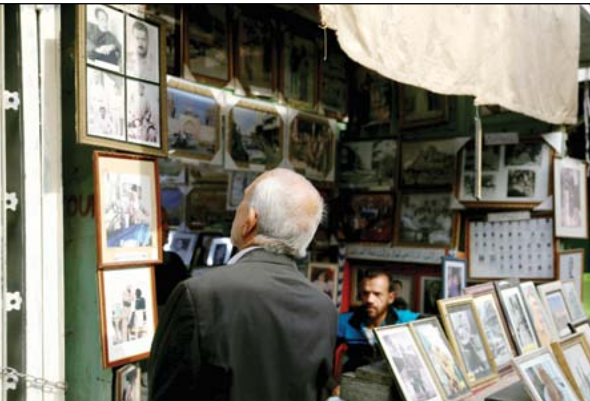
محل صغير يلخص تاريخ العراق بالصور...