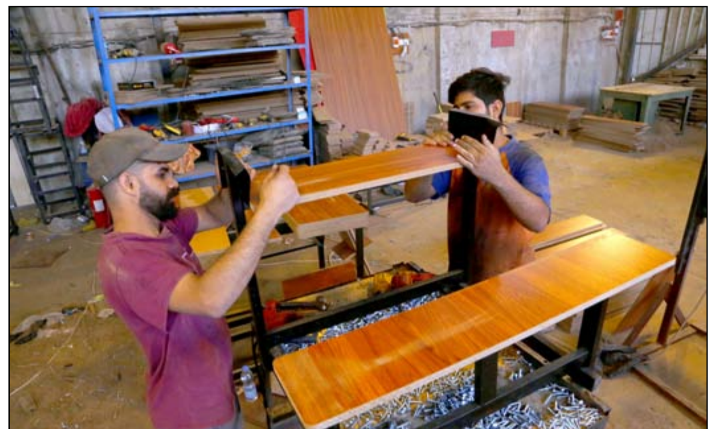
معمل اهلي لصناعة مقاعد الطلبة في بغداد

كشفت قوى في الإطار التنسيقي، أمس الأحد، عن تقديم طعون لدى المحكمة