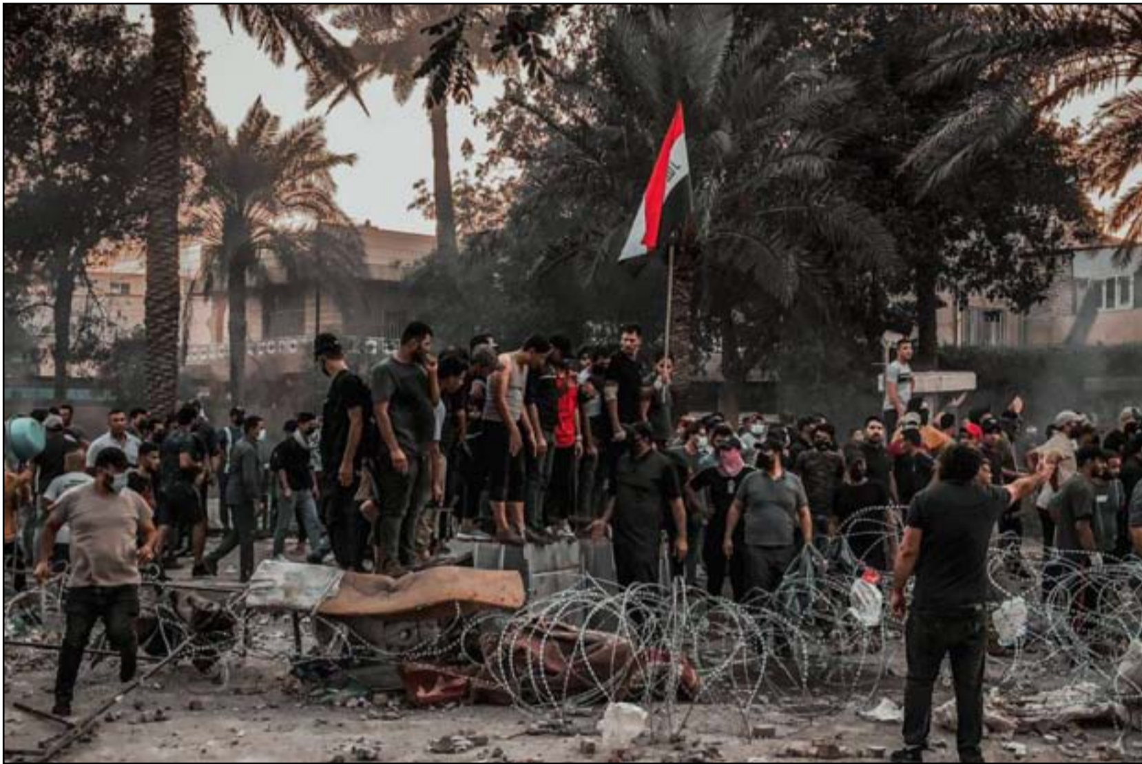
المتجون على نتائج الانتخابات يرايطون عند بوابات الخضراء بانتظار إذن التصعيد!

ويسترسل الفتلاوي، أن "تحالف الفتح يرى صعوبة إجراء الانتخابات في هذا الظرف، بالنظر لما يحتاج إليه من دعم مادي كبير وغطاء قانوني وأمني، والتحضيرات تتطلب منا وقتاً طويلاً". وشدد على أن "الحل لهذه الأزمة متاح وبيد الجهات القضائية المختصة، المتمثل بإعادة العد والفرز الشامل للنتائج". ويجد الفتلاوي، أن "حديث المفوضية عن عدم