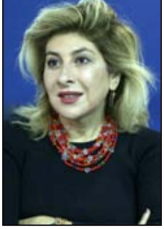
والفكرة بالاساس ان تكون هذه المكتبة متاحة للجمهور العراقي وان لا تقتصر دورى كباحثة واكاديمية وقضيت وقتاً

على اوقات الدوام الرسمي، حيث في جميع بلدان العالم تكون للمكتبات خصوصية وتوقيتها مختلف وتصل اوقات بقائها مفتوحة الى التاسعة ليلاً. وبينت الجبلي انه "كانت لوالدي عدة مكتبات، لكونه عاش فترة طويلة من حياته خارج البلد، وبعد عودته الى بغداد قام باقتناء العديد من الكتب وهي التي تكون محتويات هذه المكتبة، التي تربعنا بها في الوقت الحالي وليس جميع مكتباته المتوزعة بين لندن ولبنان والعراق"، مشيرة الى انه "كانت امينتي ان لا تقتصر هذه المكتبة على جناح معين، وانما تكون مكتبة خاصة بالراحل، لكن هذا ما هو متوفر في الوقت الحالي، والمكتبة الوطنية بحاجة الى الكثير من الاهتمام، كونها تعاني من وضع مأساوي، وهنا لا أتحدث ككوني متبرعة بل من دوري كباحثة واكاديمية وقضيت وقتاً