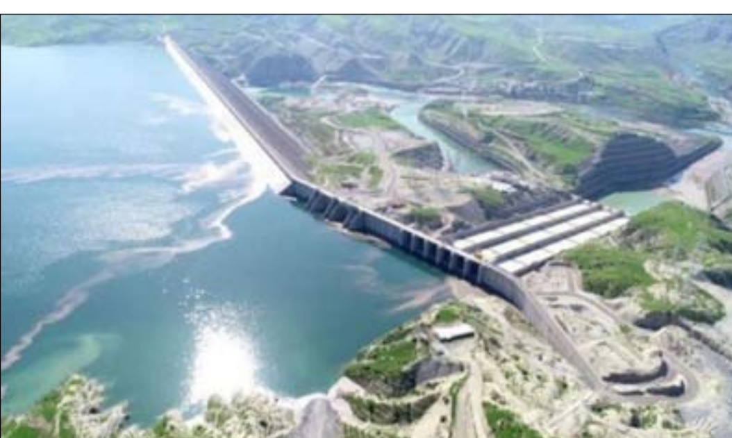
مشروع سد الفجر الجديد

إضافة إلى زراعة بعض المحاصيل بالطرق البدائية". ولفت المختص بالشأن الزراعي والمائي إلى، أن "العراق ما زال يستخدم منظومات الري القديمة، التي تؤدي بدورها إلى هدر كميات كبيرة من المياه، إضافة إلى زراعة بعض المحاصيل بالطرق البدائية". وكانت وزارة الموارد المائية، قد أعلنت عن إمكانية استخدام الخزين المائي في السدود بسبب شح الإيرادات، مشيرة إلى أنها ستلتزم "بالإطلاقات المائية لتغطية الحاجة حسب الخطة الزراعية، إضافة إلى الإطلاقات المائية لتأمين الاحتياجات الأخرى، منها محطات الاسالة (مياه الشرب) وكذلك الأهار ولسان ملح البصرة، فضلاً عن الاستخدامات الصحية والكهرومائية".