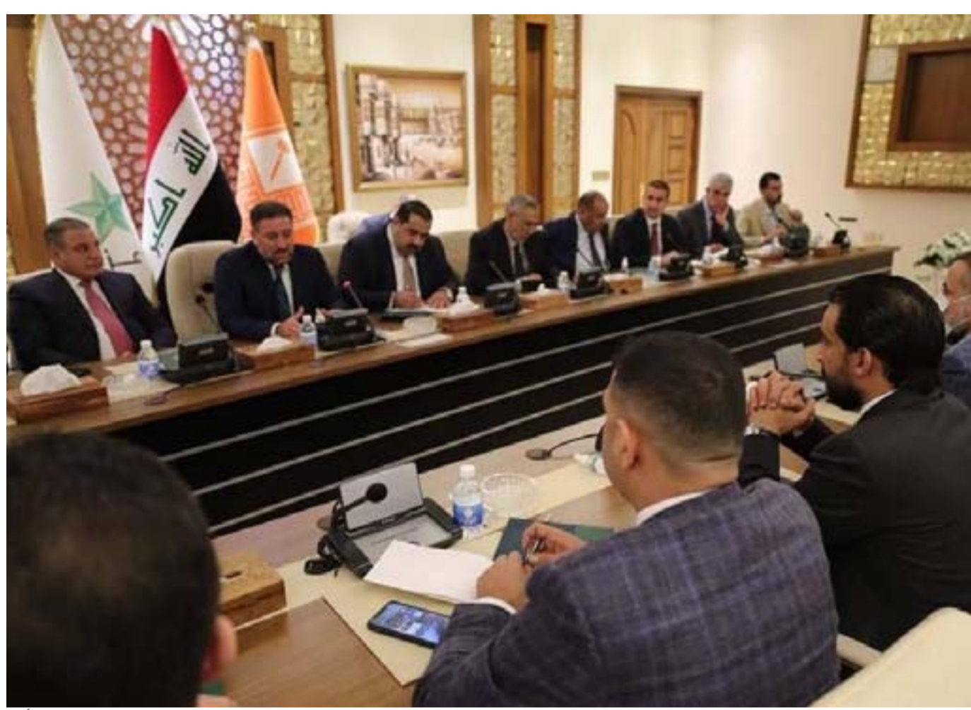
جانب من اجتماع تحالفي تقدم وعزم أمس

وجاء هذا الاتفاق بعد جولتين من المفاوضات الأولى تمت في مقر إقامة الخنجر والثانية في مقر إقامة الحلبوسي.