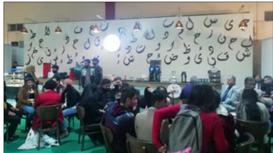
نجدها حاضرة دوما لتلبية طلبات الزوار خلال فترة استراحتهم. لاحتساء القهوة والمشروبات النشر المشاركة.

وانت سائر في طريقك بين مرمرات أقسام الكتب المنتشرة على رفوف أجنحة دور النشر والمكتبات التي تتوزع بين أجنحة معرض الكتاب تلمج مجموعة من الأصدقاء وهم يتبادلون أطراف الحديث في آخر المر بمشهد متناغم بين الكتاب الركن الأساس لهذا الحدث ومن يغوص في محتواه للتثقيب فيه وجهها لوجه مع رفاق الفكر.