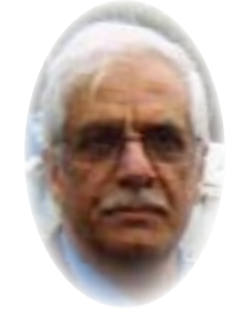
■ لutfي حاتم

الركائز الفكرية - السياسية التالية- ١. تعذر وحدانية قيادة الحزب الاشتراكي لسلطة البلاد السياسية والاحتفاظ بها تتطلب وحدة اليسار الاشتراكي - الديمقراطي. ٢. وحدة اليسار الاشتراكي - الديمقراطي تستند على أساس صيانة الدولة الوطنية الديمقراطية ومكافحة التبعية واللاحق. ٣. وحدة اليسار الاشتراكي - الديمقراطي تسعى الى تطوير دور الدولة في الاقتصاد الوطني بما يمنح هيمنة الطبقات الفرعية على الاقتصاد الوطني.