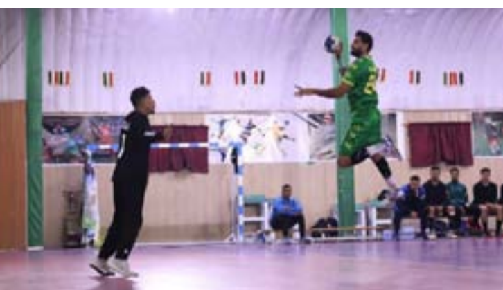
تحقيق الفوز الصعب والثاني بالتوالي على فريق المسيب (٢٥-٢١) ليقتنص الفريق المركز التاسع بست نقاط، بينما هبط فريق المسيب إلى المركز العاشر بأربع

وأشار إلى أنه: في مباراة الهبوط من المراكز المتأخرة استطاع فريق الكوفة من