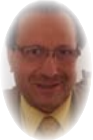
■ جواد بشارة

يؤكد غورباتشوف بوضوح أن توسيع حلف الناتو سيشكل خيانة لما يرى "روح المناقشات من ذلك الوقت، لكنه يؤكد مجدداً أنه لم يتم تقديم أي التزام رسمي. يواصل الروس الادعاء بأن مفاوضات موسكو مع ذلك ضمانات غير رسمية. نظرية لها ميزة كونها بطبيعتها من المسجل التحقق منها. وبالمقابل يتهم الغرب أن روسيا انتهكت معاهدة عدم استخدام القوة لإعادة السيطرة على دول أوروبا الشرقية المسلحة من حلف وارسو