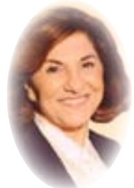
■ بثينة شعبان

بوابة الثقافة واللغة العربية الواحدة أداة الإنتاج الفكري والمعرفي في كافة أقطار وطننا العربي تتجاوز الحدود القطرية وتلج الأمصار العربية من أوسع أبوابها.