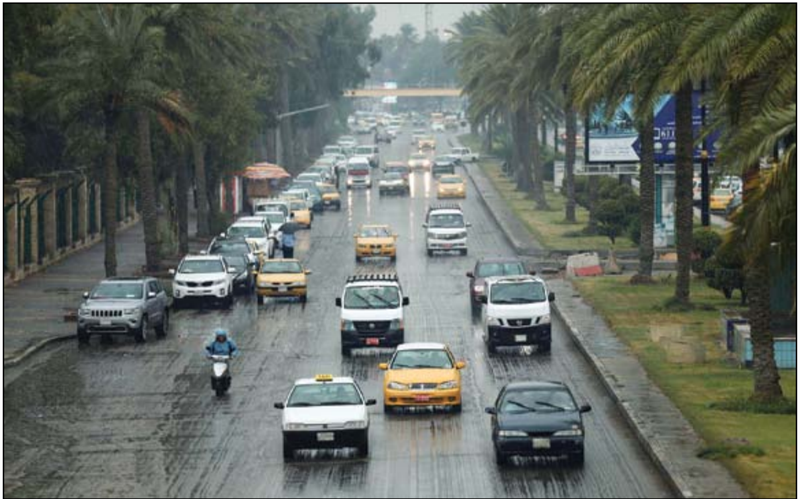
هل تجوز شوارع بغداد من فيضانات الشتاء...؟