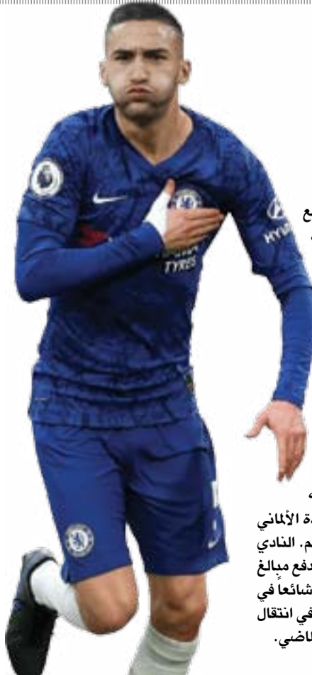
زياش بديلاً عن تورييس في صفقة برشلونة!

وحسب صحيفة "موندو ديبورتيفو" الإسبانية، أصبح برشلونة قريباً جداً من الوصول إلى اتفاق بشأن انتقال فيران تورييس نجم مانشستر سيتي الإنكليزي بقيمة ٥٠ مليون يورو سيما أن ييب غوارديولا مدرب مانشستر سيتي أخبر النادي بموافقة على انتقال تورييس إلى برشلونة. وفي حالة فشل الصفقة المرتقبة، يفكر برشلونة بالمغربي حكيم زياش نجم تشيلسي الإنكليزي، لضمه بدلاً من الإسباني. المغربي يعيش أوقاتاً سيئة تحت قيادة الألماني توماس توخيل، ولا يشارك بشكل أساسي منذ بداية الموسم. النادي الإسباني سيقوم بدفع المبلغ على دفعات، بينما سيبدأ دفع مبالغ الشراء في المستقبل القريب وليس الآن، وهو أمر أصبح شائعاً في عقود بيع اللاعبين خاصة بالدوري الإيطالي كما حدث في انتقال متوسط ميدان ساسولو، لوكاتلي إلى يوفنتوس الصيف الماضي.