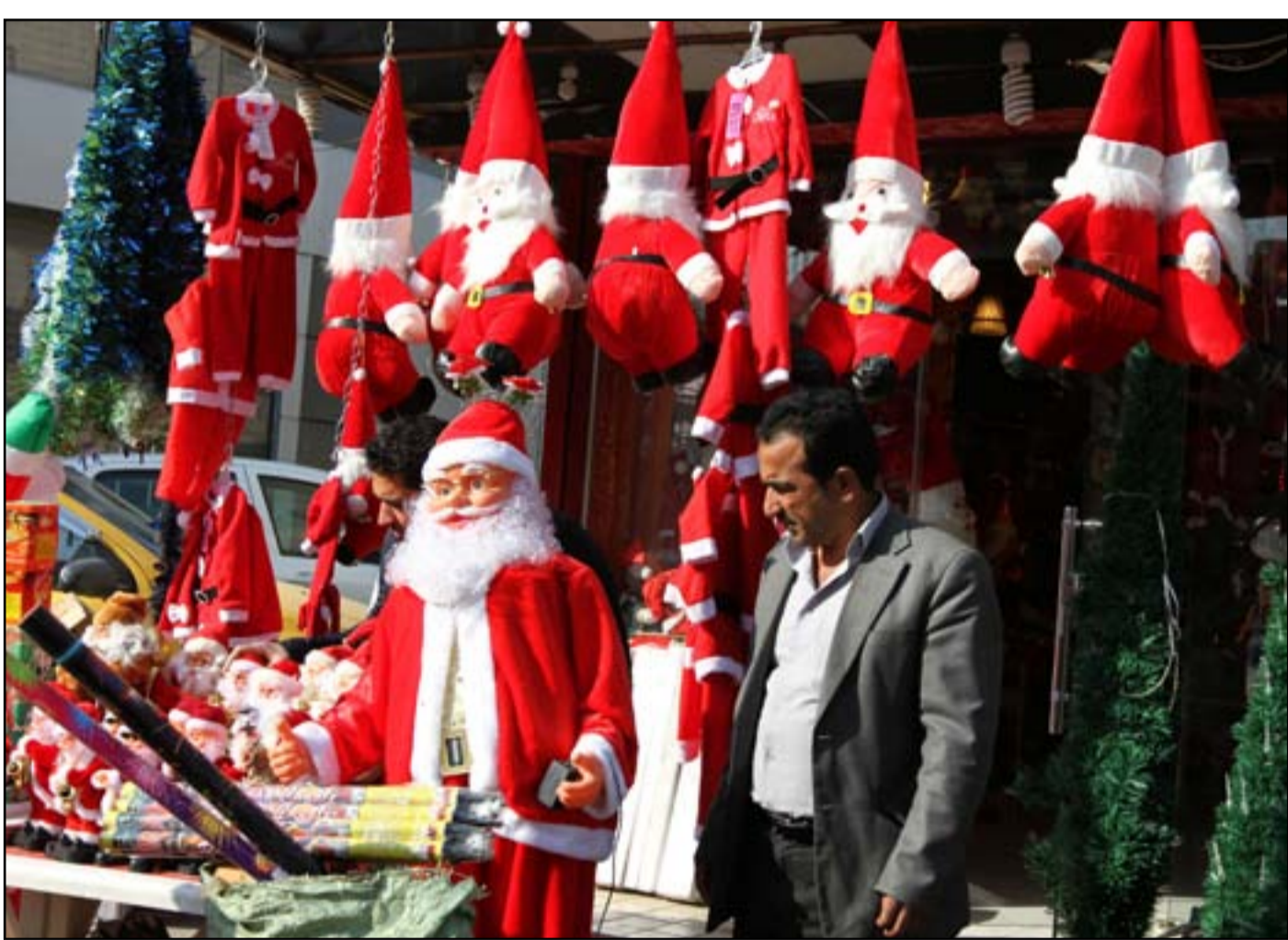
محلات بيع الهدايا تنتهش في اعياد رأس السنة.. عدسة: محمود رؤوف

بها في الحوار بين الولايات المتحدة والعراق". كما أوضح أن "مهمة القوات الأميركية وقوات التحالف المتبقية في العراق الأساسية تقتصر على تقديم المشورة والمساعدة، وتمكين قوات الأمن العراقية من الحفاظ على الهزيمة الدائمة لداعش". وكانت قيادة العمليات المشتركة في البلاد أعلنت مطلع الشهر الحالي (كانون الأول/ديسمبر 2021)، أن القوات القتالية للتحالف ستفادر بالكامل قبل نهاية الشهر.