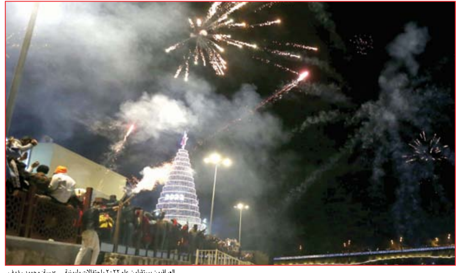
العراقيون يستقبلون عام ٢٠٢٢ باحتفالات مليونية...

يبحث العراق عن تطوير تشكيلات سلاح الجو بعد انتهاء مهام القوات القتالية للتحالف الدولي، ويشمل ذلك دعم طيران