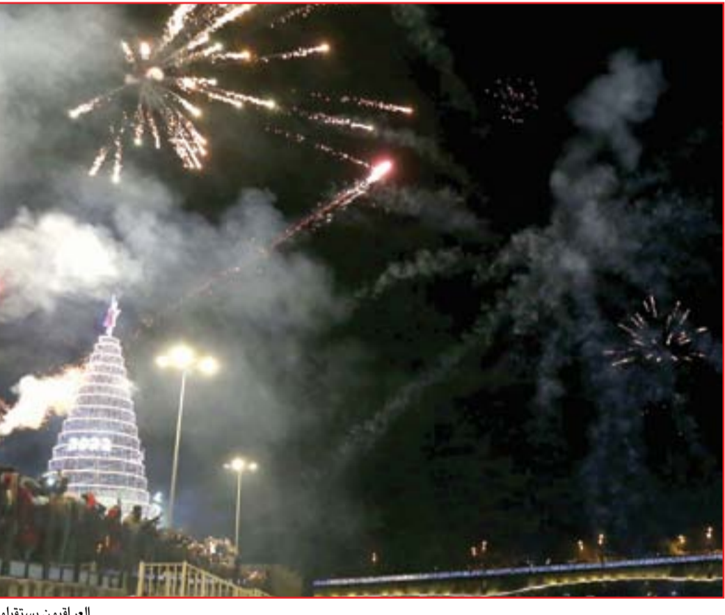
العراقيون يستقبلون عام ٢٠٢٢ باحتفالات مليونية...