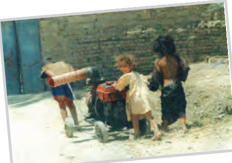
الصورة الفائزة بالجائزة الفضية