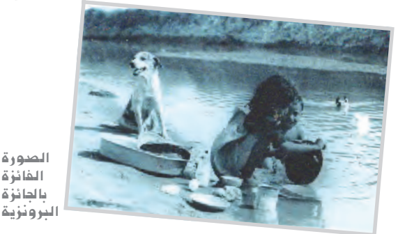
الصورة الفائزة بالجائزة البرونزية