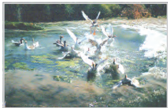
الصورة الفائزة بالجائزة الذهبية