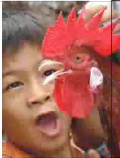
طفلك يقبل صياح الديك قرب مايبلا.. من الجدير بالذكر ان الفلبين هي من بين الدول الاسيوية القليلة التي بقيت خالية من مرض انفلونزا الطيور.