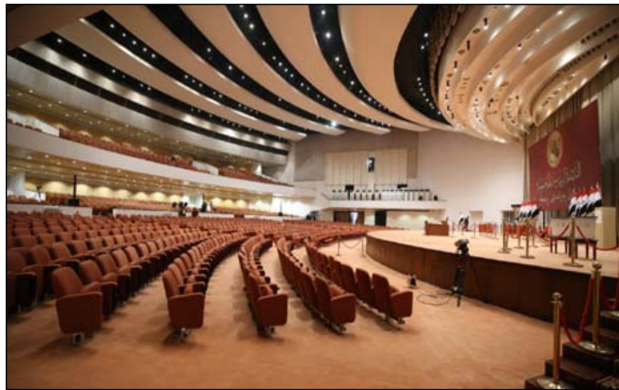
تهيئة قاعة مجلس النواب استعداداً للجلسة الأولى اليوم الأحد

ويشير التقرير إلى أن أكثر الكتل، ضمن هكذا منظومة حكم، تعمل على رعاية مصالحها الحزبية الخاصة بدلاً من خدمة مصالح الدولة، وبالتالي فإنه بدلاً من إيجاد إدارة دولة دستورية، تظهر بالمقابل هيكلية دولة هشّة مع