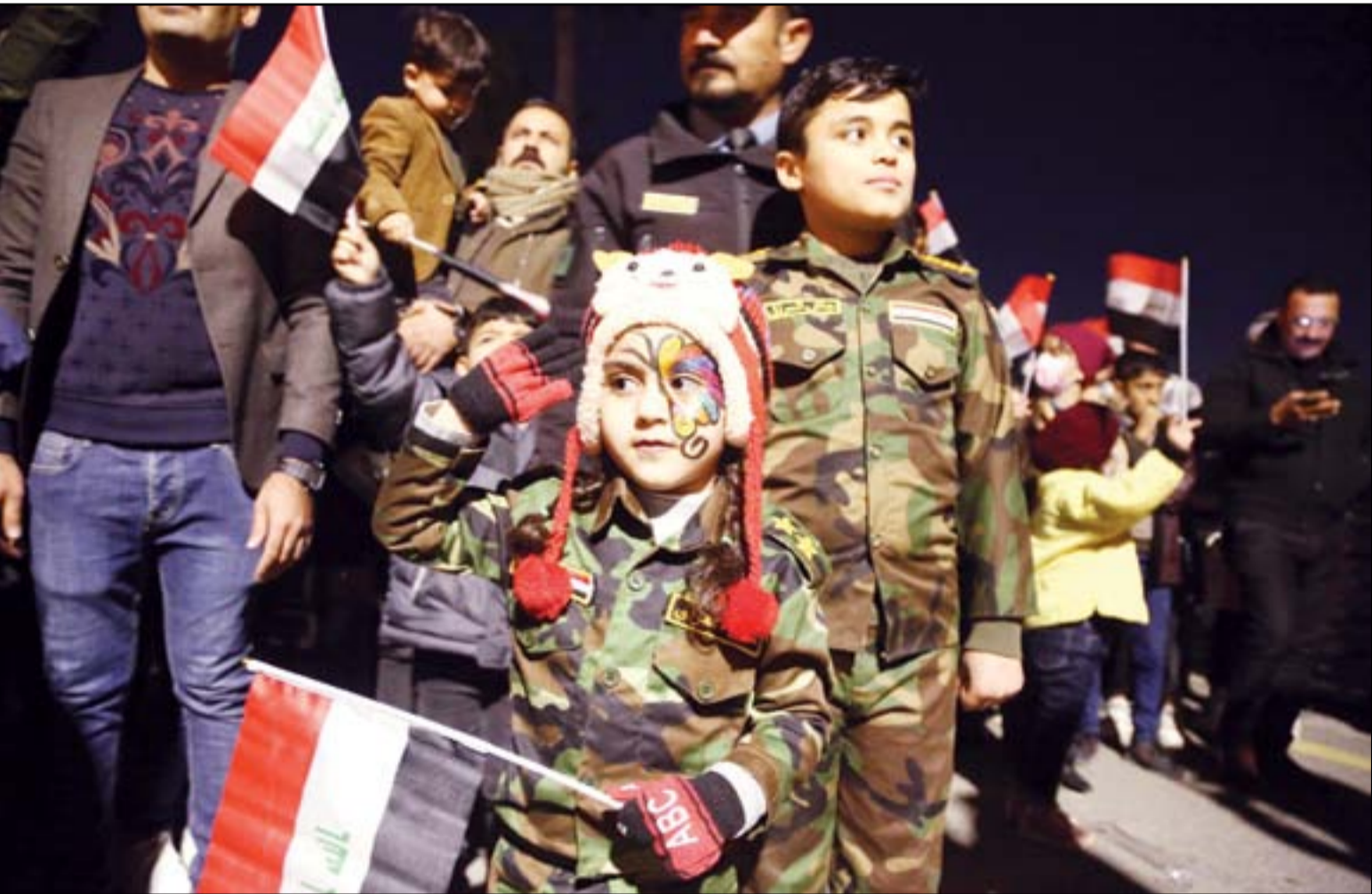
احتفالات شعبية واسعة بعيد الجيش...