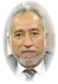
د. ناجح العبيدي

الصراحة ليست من شيم السياسيين عادة، لكن وزير المالية العراقي علي علاوي شذ عن هذه القاعدة على الأقل في كلمته أمام (الملتقى الوزاري لأفاق طاقة المستقبل) عندما كشف بوضوح عن التحديات الخطيرة التي تنتظر الاقتصاد العراقي في المجالين النطفي والمالي على المدى المتوسط والبعيد. ربما ياس علاوي من تولي حقيبة وزارية في الحكومة الجديدة المرتقبة، ولكن هذا لا يقلل من أهمية صراحة وجراحة مداخلته أمام مسؤولي قطاع النفط العراقي.