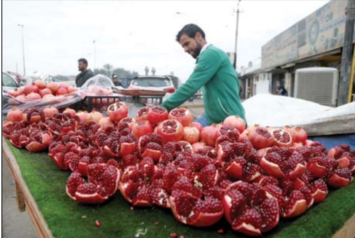
الفواكه المستوردة تغزو الاسواق العراقية.. عدسة: محمود رؤوف

كشفت شركة التسويق النفطي، سومو SOMO، في معلومات لها عن الصناعة النفطية العراقية بان معدل الإنتاج الكلي للنقط بضمنها كميات انتاج إقليم كردستان قد ارتفع خلال شهر كانون الأول بنسبة 0.4% ليصل الى 4.225 مليون برميل باليوم، في وقت أشارت فيه الى ان صادرات العراق النفطية خلال عام 2021 تجاوزت المليار برميل.