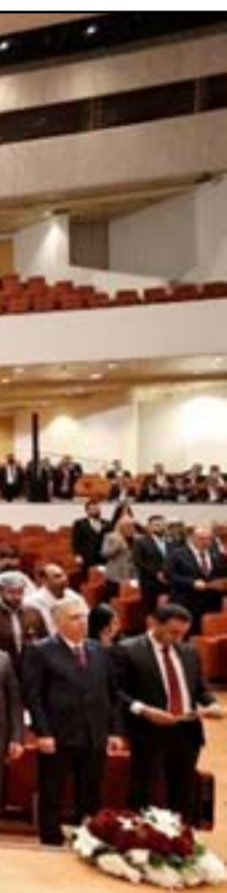
مؤامرين داخل الجلسة، اكادوا ان محمود المشهداني، 73 عاما وهو رئيس السن الذي اختارته المفوضية لادارة الجلسة الافتتاحية "لم يتعرض الى هجوم كما ادعى".

المشهداني من كرسى الرئاسة إلى المستشفى مصادر سياسية ونواب جدد كانوا