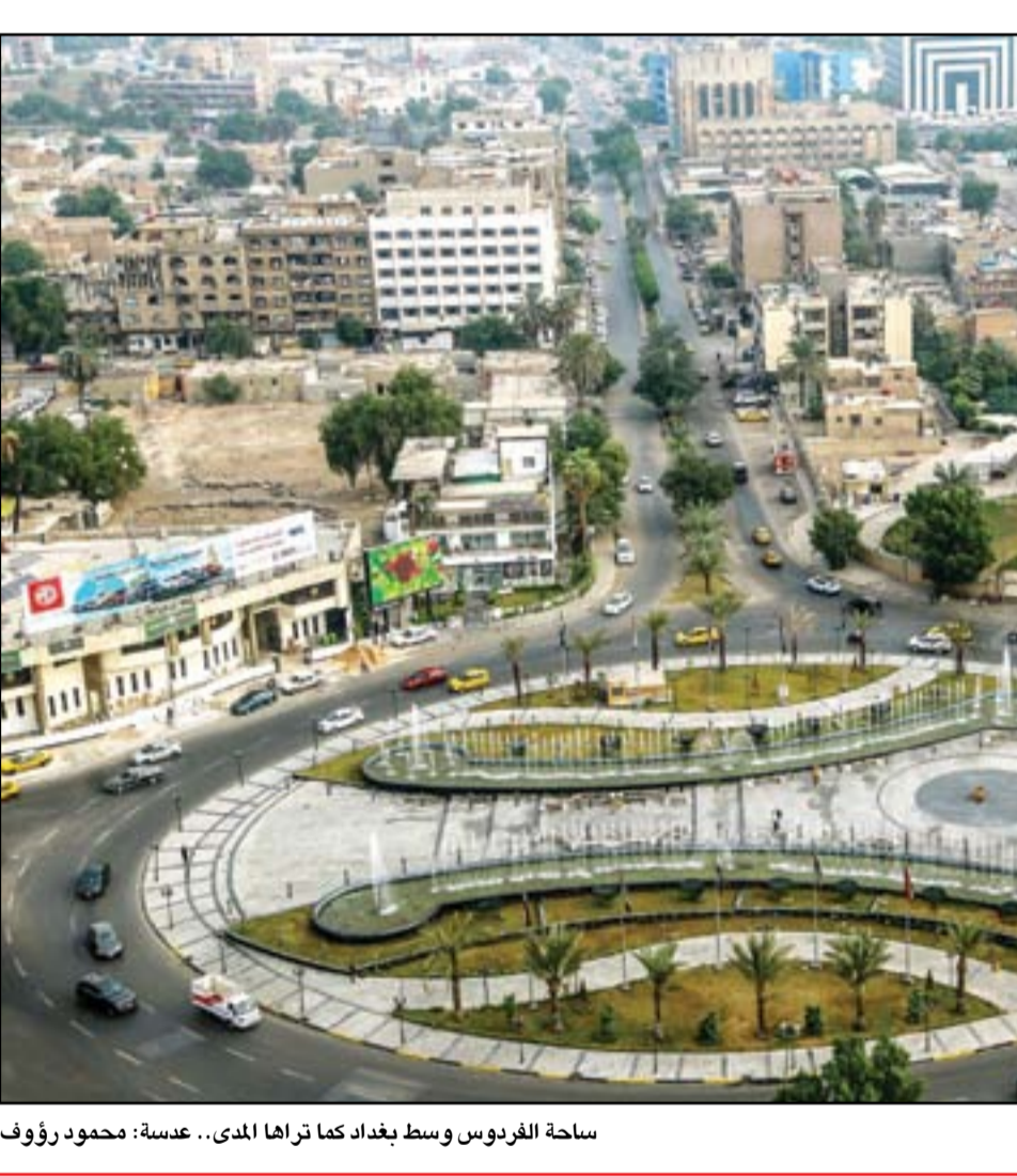
ساحة الفردوس وسط بغداد كما تراها المدى..