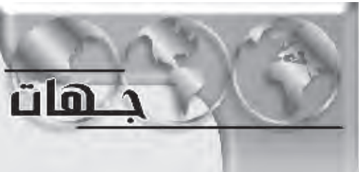
المدى / وكالات

جهايات تقدم النائب الاميركي الديموقراطي جون مورتا باقتراح رسمي لانسحاب "فوري" للقوات الاميركية من العراق، لان الولايات المتحدة لم يعد في امكانها ان تنجز شيئا عسكريا في هذا البلد. وقال مورتا، المحارب السابق في فيتنام واحد المسؤولين عن موازنة وزارة الدفاع في مجلس النواب، "اعتقد انه يجب ابلاغ الشعب العراقي والحكومة المقبلة قبل الانتخابات العراقية المقررة في منتصف كانون الاول، بان الولايات المتحدة ستنفذ اعادة انتشار فوري".