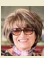
ليس في أمر الحكاية ما يثير القارئ العادي. ليس ماركيز أول وآخر من أقام علاقة خارج نطاق المؤسسة الزوجية وأنتجت تلك العلاقة أطفالا عروفا في حياته أو بعد مماته.

أرى خلل الرماذ وميض نار ويوشك أن يكون لها ضرام نجن - القراء - لايهنا من ماركيز سوى كولونيله الذي لم يحد من مكانته، أو حكاية غانياته المزينات، أو الأعرام المأفة من العزلة، أو عيشه الذي أعلن عنه في سيرته الذاتية، وكل ماسوى ذلك إن هو إلا عرس (بنات أوى) تتقال على مغن ليس لنا منه شيء، ولن يفيدنا بشيء.