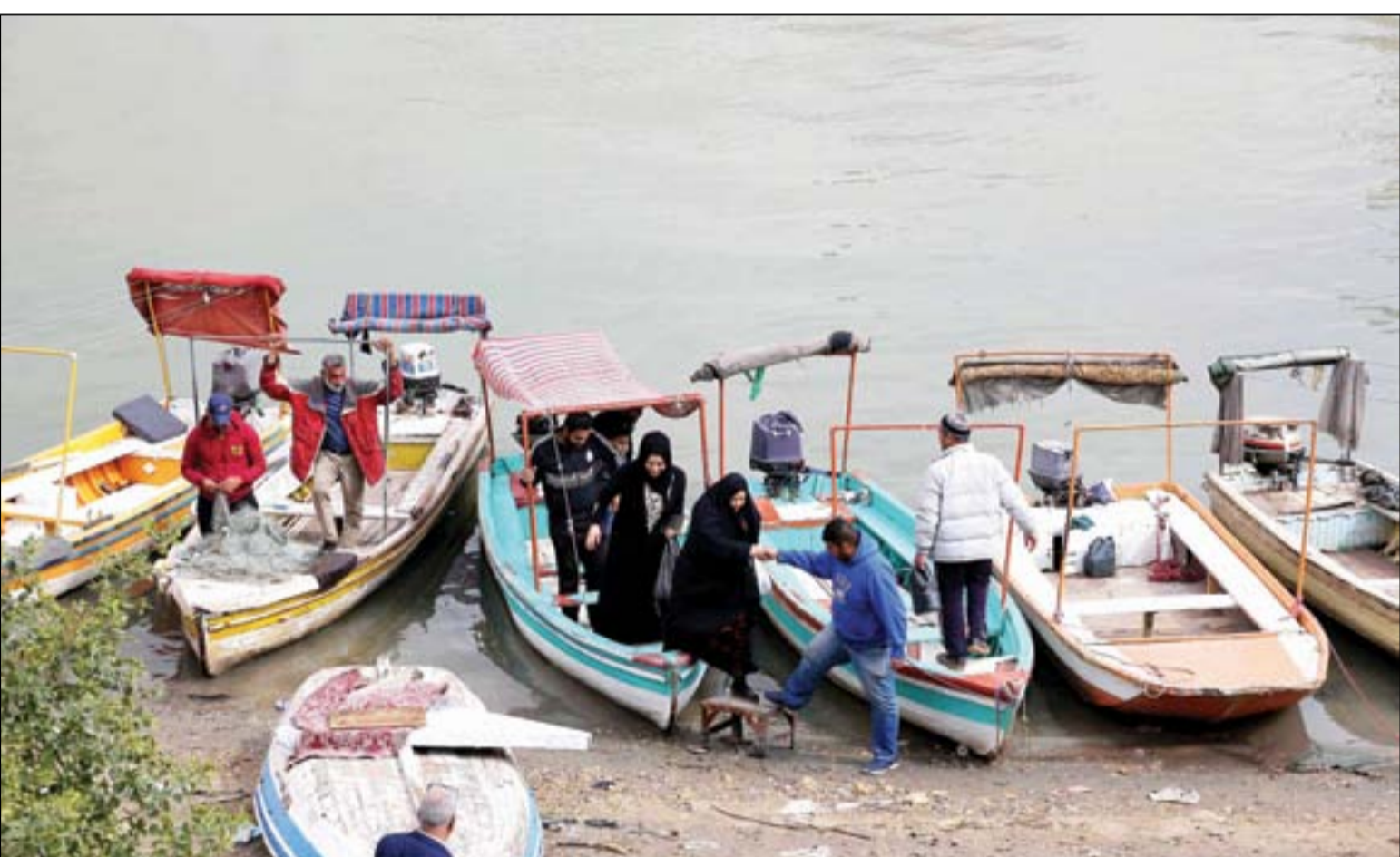
تكسي النهر ينتعش مع نفاخ ازمة الزحامت المروية..

تشير التوقعات إلى أن تحالف الأغلبية سوف يسرع في تشكيل الحكومة المقبلة، أمام رفض واضح لإشراك جميع القوى فيها، وضرورة أن تكون هناك معارضة يقودها ائتلاف دولة القانون بزعامه نوري المالكي. ورفض التيار الصدري الانصياع إلى ضغوط مارستها قوى داخلية وإقليمية للتراجع عن مشروعه في الإصلاح، ويسعى اليوم لإكمال ما بدأ به قبل الانتخابات رغم محاولات استهداف شركائه من خلال استخدام وسائل العنف بهدف التأثير في إرادتهم. وعلى الطرف الأخرى، ما زال ائتلاف دولة القانون