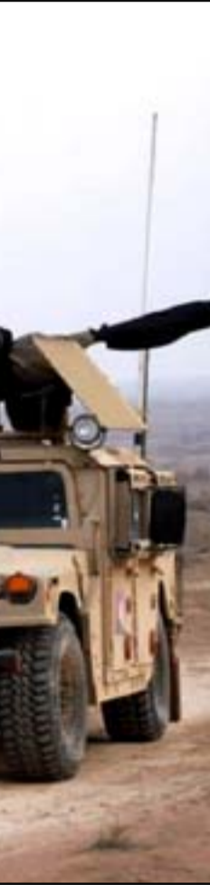
انطلاق عملية امنية واسعة في صحراء الانبار

ديالى وصلح الدين وكركوك والموصل والانبار خطير جدا". وتابع: "التهديدات المحدقة بتلك المناطق ليست تدفقات فردية وانما مخطط مدروس وضاعط يبدأ من احداث الحسكة في سوريا وينتهي بأروقة التجاذبات السياسية في العراق". ومر اكثر من 3 أشهر على انتهاء عملية التصويت في الانتخابات التشريعية المبكرة، ولم تخرج حكومة جديدة حتى الان.