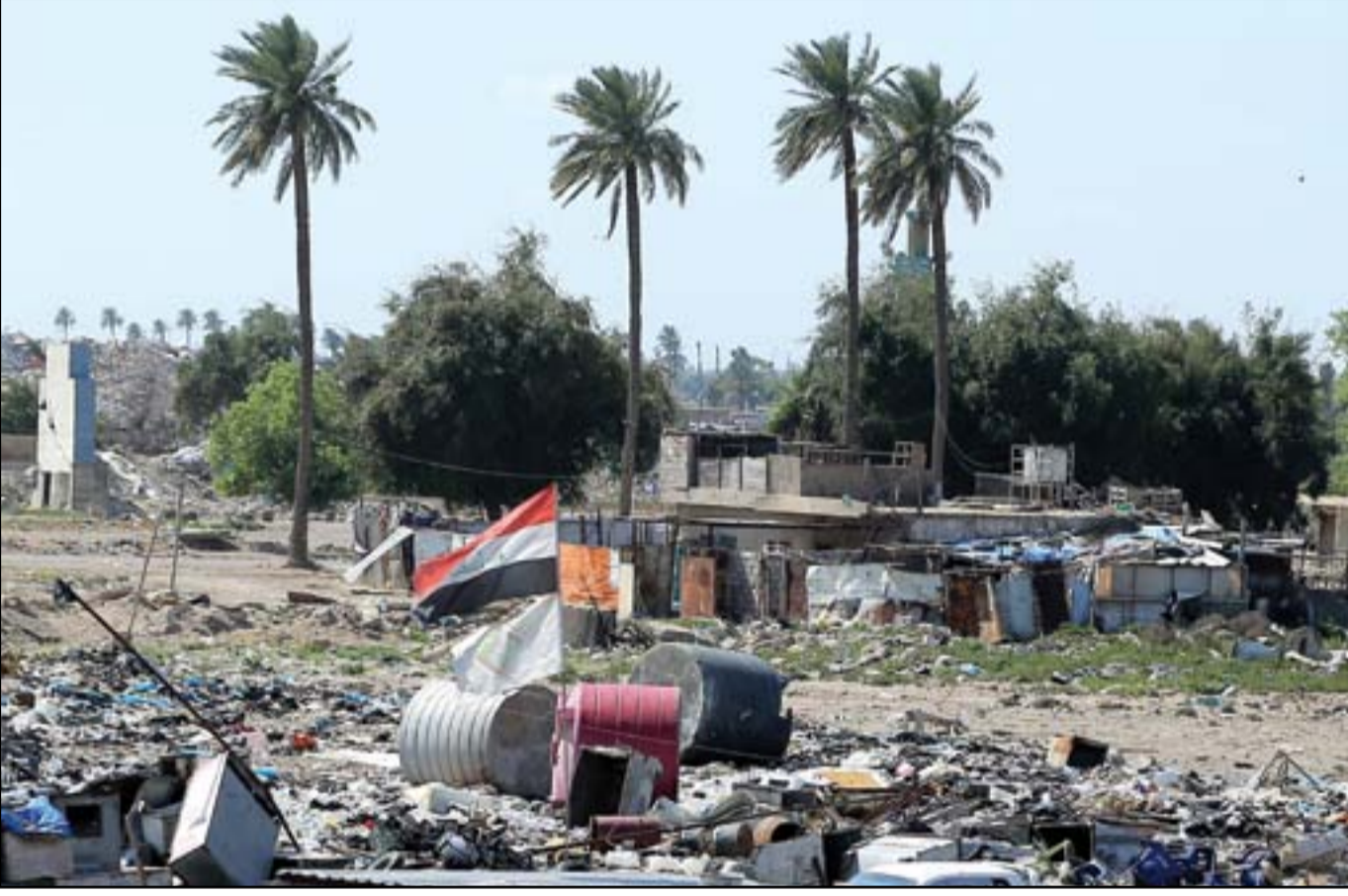
اضرار بيئية كبيرة تسبب بها نفايات معسكر الرشيد...

6 رشيد الخيون يكتب: الشببيبي.. طاله تعسف أمين (الدعوة)