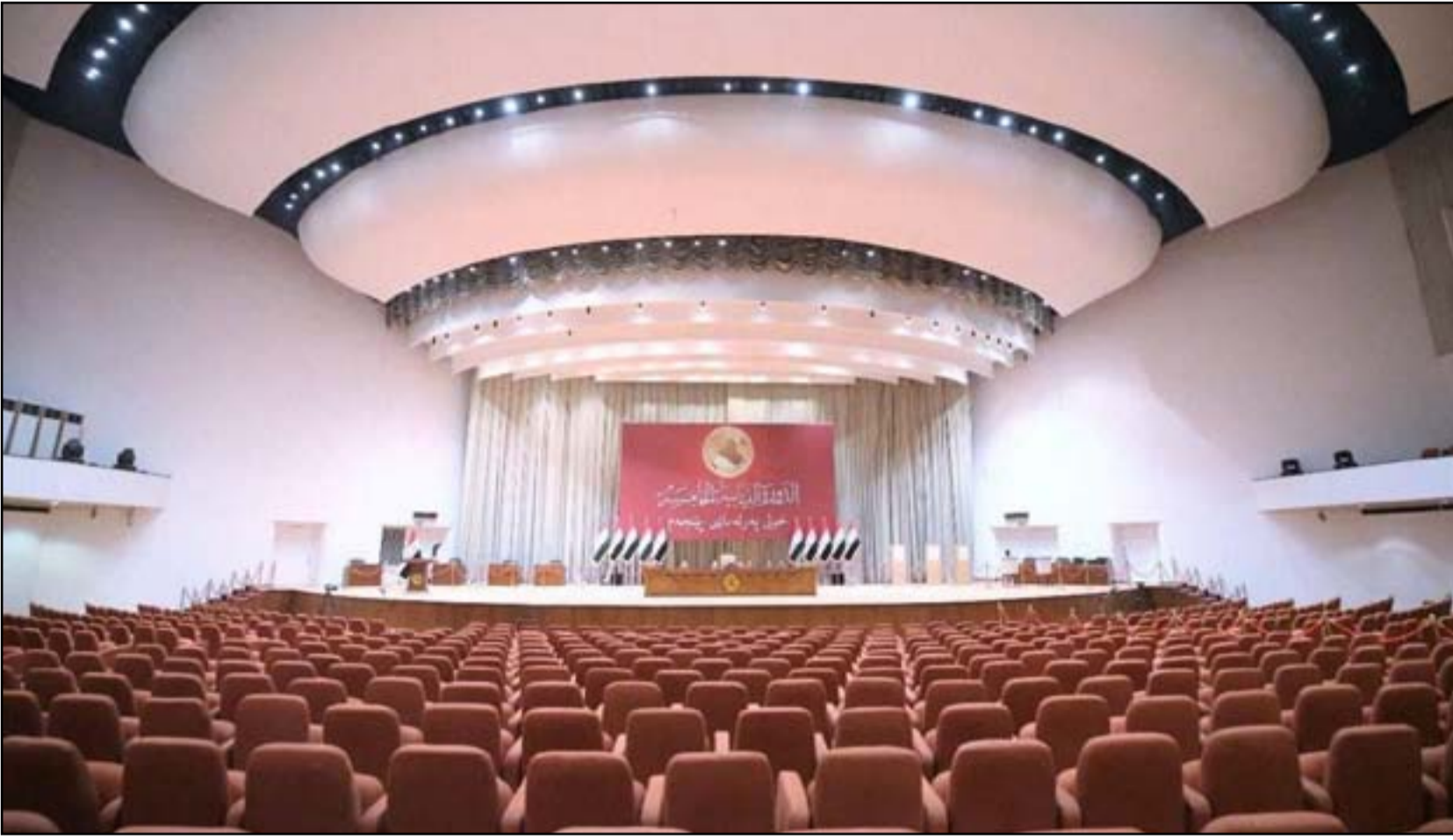
7 شباط موعد انعقاد جلسة البرلمان لانتخاب رئيس الجمهورية