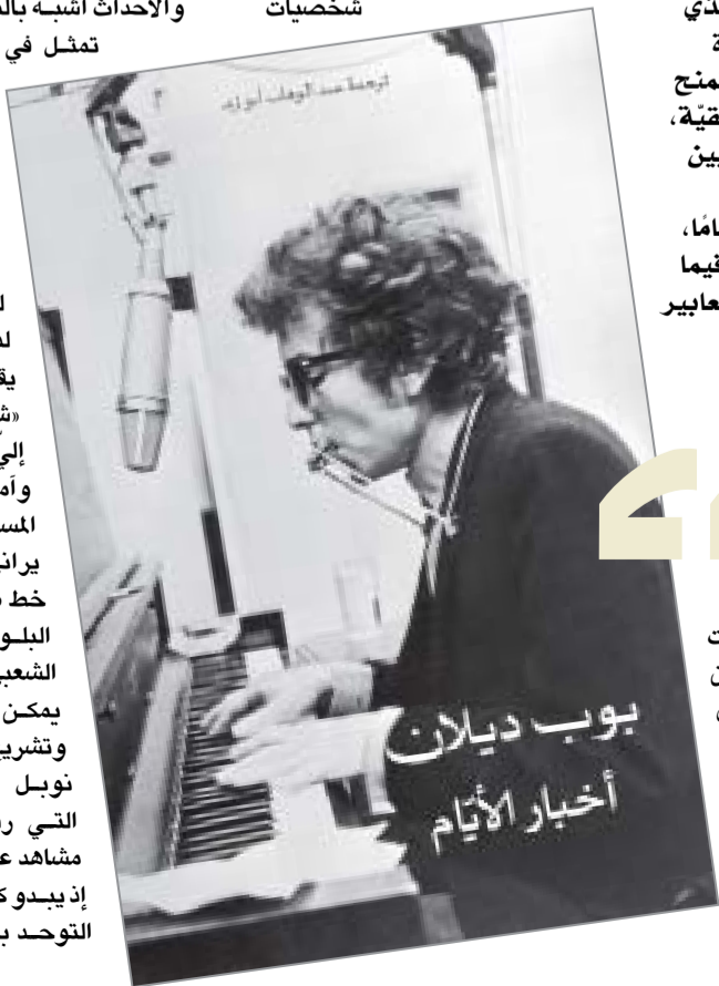
بوب ديلان أخبار الأيام