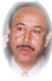
د. قاسم حسين صالح

التحالفات السياسية في كل بلدان العالم، حالة مشروعة ان كانت من اجل تنفيذ برنامج يهدف الى خدمة المواطن واعمار الوطن، لكن ما جرى في العراق.قبل واثناء انتخابات مجالس المحافظات، هو صفقات تهدف الى خدمة مصالح شخصية وحزبية وصفها المتحالفون انفسهم بانها فقدت المبدئية والقيم الاخلاقية،وانها اتسمت بالقدر والخيانة. فقد حدث في اكثر من محافظة خلال تشكيل حكوماتها المحلية في حزيران 2013 ان الكتلة (س)التي تحالفت مع الكتلة(ص)تفاجأت بأن اعلنت (ص) تحالفها مع الكتلة (ع) التي هي على خلاف مع الكتلتين لسنين!.. وهذا هو المصوب بالصفقات..وصفها ميكافيلية تعتمد مبدأ الغاية تبرر الوسيلة..والغاية هنا مصلحة يحكمها الانتماء الى حزب او كتلة سياسية وتغلبه على الانتماء للوطن،وما زال موجودة الآن(2022).. في مفارقة أن على رأس السلطة رئيس وزراء مستقل