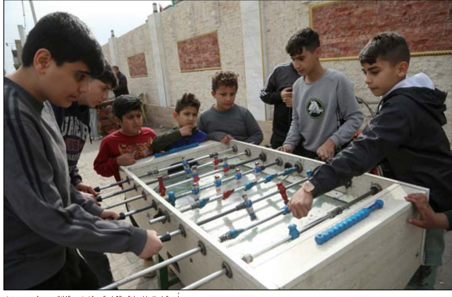
بعبداً عن ألعاب الموبايل مازالت الألعاب اليدوية تشتهى الأطفال...

بغداد / تميم الحسن ومؤخراً، كشفت الغارة الاخيرة على مجموعة من عناصر التنظيم في شمالي ديالى، عن ان من بينهم مسلحون قتلوا في الغارة، هم عرب ويبدو انهم وصلوا الى العراق قبل اسابيع فقط. وخلال السنوات الماضية، كانت كل المعلومات تشير الى ان العمليات التي