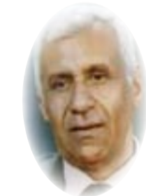
■ فوزي عبد الرحيم

كانت تقف خلف الجادرجي وتوفّر بيئة ملائمة لمواقفه السياسية، والمفت أيضاً فهم الجادرجي للواقع العراقي الذي ميز بعض مواقفه غير الشعبية فرغم تأييده لشورة 14 تموز 1958 إلا أنه حجب دعمه عن الزعيم عبد الكريم قاسم لعدم وفاءه بعودة الحياة الحزبية والنيابية وقد كنت شخصياً وإلى عقدين من الزمن مستقراً من موقفه الجاف وغير وطني وهو ما كان لاحقاً موقفاً للنظام الملكي وبالذات لرئيس الوزراء العتيدي نوري السعيد الذي رأى باحثون أن الجادرجي وجهوده السياسية هي التي هيأت الظروف لنهاية السعيد ونظامه.. إن المنتعق لسيرة الجادرجي وحزبه الوطني الديمقراطي تستوقفه الصلابة والمبدأية التي هي ليست سمات الساسة البورجوازيين في أي مكان وهو ما يستحقّ الدرس والتأمل، ويشير بانتهار لفئة إجتماعية عصرية تقدمية