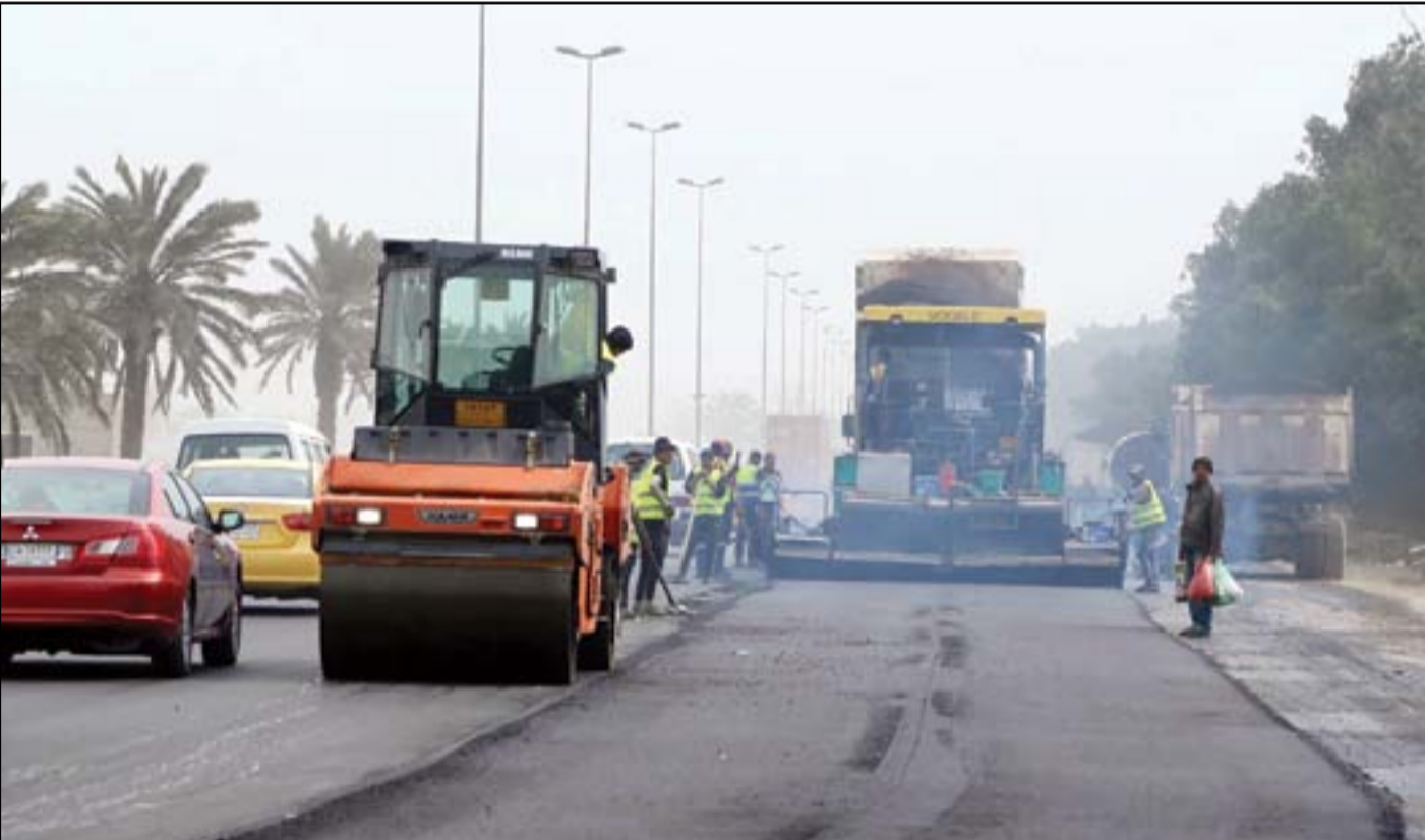
امانة بغداد تباشر بأكساء طريق شرق القناة.. بعد سنوات من الهمال.. عدمة محمود رؤوف