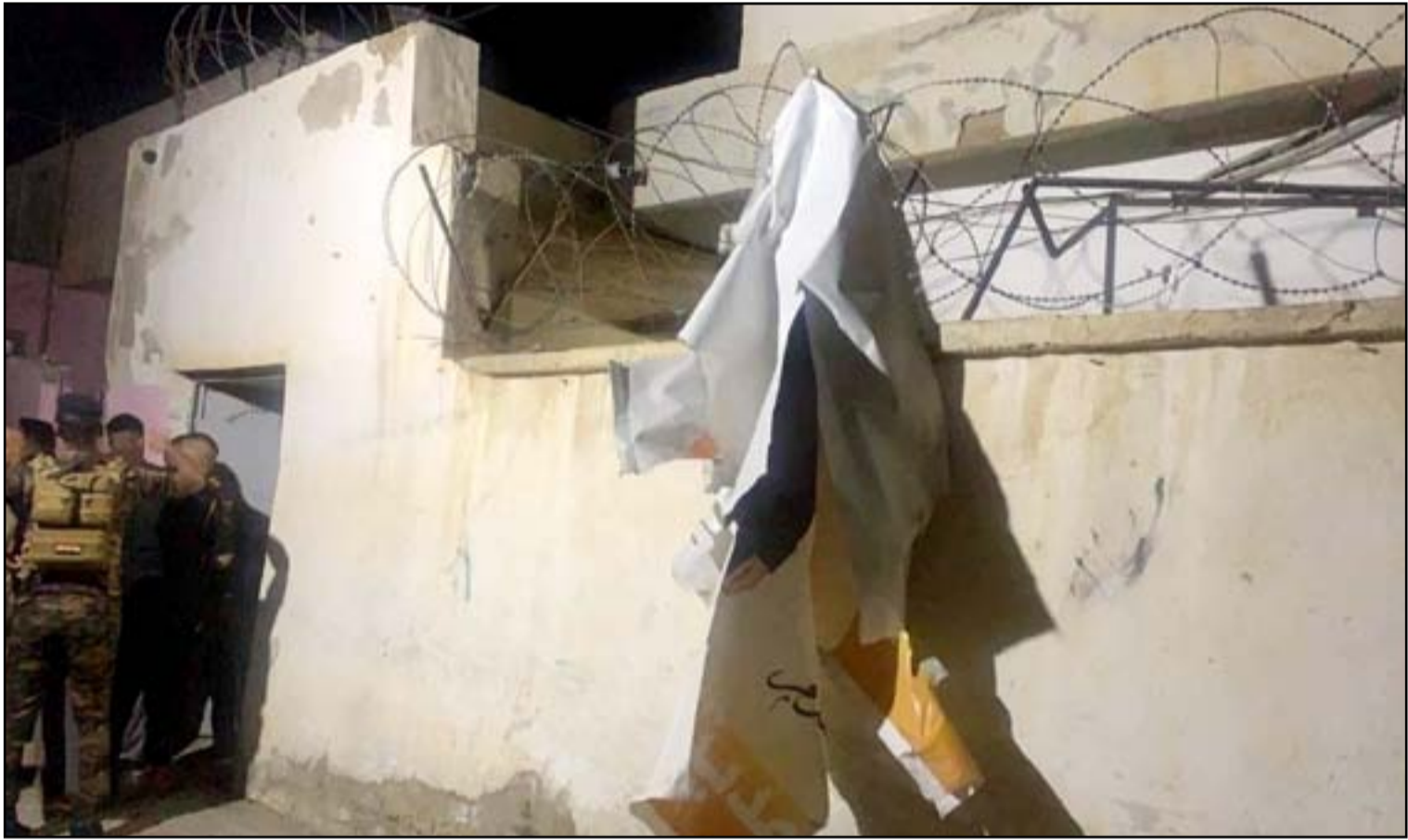
مقر حزب تقدم في هيت بعد استهدافه أمس الأول

وأشار زعيم التيار الصدري، مساء الجمعة، في تغريدة على "تويتر" مستخدماً بيت شعري، بأنه "لا يخشى الموت" على أثر إعلان وجود تهديدات تطال مشروع