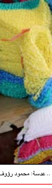
حياكة "للينة" .. مهنة بالكاد توفر قوت اليوم

الانتخابات التشريعية التي جرت في 10 تشرين الأول، لم تتوصل الطبقة السياسية الى اتفاق لتشكيل الحكومة، رغم خوض اكثر من جولة مفاوضات. وكانت قرارات المحكمة الاتحادية قد زادت من عمق الأزمة، بعد استبعاد هوشيار زيباري، ابرز المرشحين لرئاسة الجمهورية.