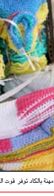
حياكة "للينة" .. مهنة بالكاد توفر قوت اليوم .. عدسة: محمود رؤوف

الانتخابات التشريعية التي جرت في 10 تشرين الأول، لم تتوصل الطبقة السياسية الى اتفاق لتشكيل الحكومة، رغم خوض اكثر من جولة مفاوضات. وكانت قرارات المحكمة الاتحادية قد زادت من عمق الأزمة، بعد استبعاد هوشيار زيباري، ابرز المرشحين لرئاسة الجمهورية.