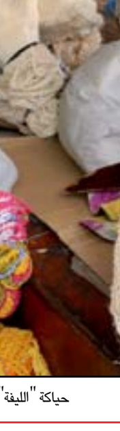
حياكة "للينة" .. مهنة بالكاد توفر قوت اليوم .. عدسة: محمود رؤوف

الانتخابات التشريعية التي جرت في 10 تشرين الأول، لم تتوصل الطبقة السياسية الى اتفاق لتشكيل الحكومة، رغم خوض اكثر من جولة مفاوضات. وكانت قرارات المحكمة الاتحادية قد زادت من عمق الأزمة، بعد استبعاد هوشيار زيباري، ابرز المرشحين لرئاسة الجمهورية.