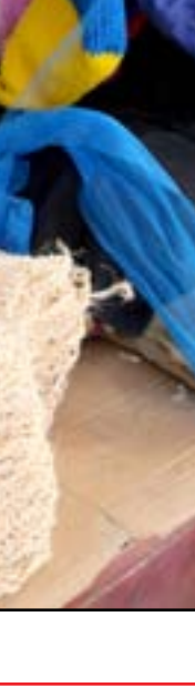
حياكة "للينة" .. مهنة بالكاد توفر قوت اليوم .. عدسة: محمود رؤوف

الانتخابات التشريعية التي جرت في 10 تشرين الأول، لم تتوصل الطبقة السياسية الى اتفاق لتشكيل الحكومة، رغم خوض اكثر من جولة مفاوضات. وكانت قرارات المحكمة الاتحادية قد زادت من عمق الأزمة، بعد استبعاد هوشيار زيباري، ابرز المرشحين لرئاسة الجمهورية.