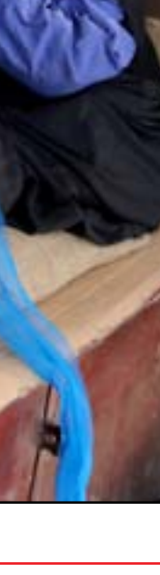
حياكة "للينة" .. مهنة بالكاد توفر قوت اليوم .. عدسة: محمود رؤوف

الانتخابات التشريعية التي جرت في 10 تشرين الأول، لم تتوصل الطبقة السياسية الى اتفاق لتشكيل الحكومة، رغم خوض اكثر من جولة مفاوضات. وكانت قرارات المحكمة الاتحادية قد زادت من عمق الأزمة، بعد استبعاد هوشيار زيباري، ابرز المرشحين لرئاسة الجمهورية.