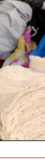
حياكة "للينة" .. مهنة بالكاد توفر قوت اليوم .. عدسة: محمود رؤوف

الانتخابات التشريعية التي جرت في 10 تشرين الأول، لم تتوصل الطبقة السياسية الى اتفاق لتشكيل الحكومة، رغم خوض اكثر من جولة مفاوضات. وكانت قرارات المحكمة الاتحادية قد زادت من عمق الأزمة، بعد استبعاد هوشيار زيباري، ابرز المرشحين لرئاسة الجمهورية.